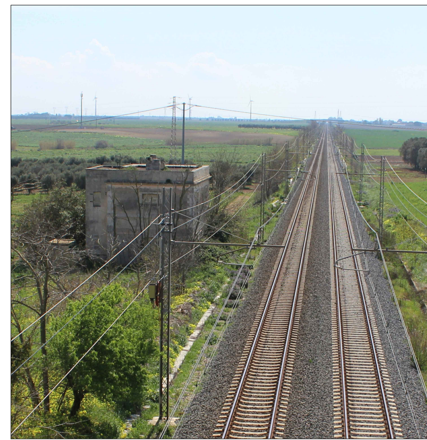
STRUTTURA IN MURATURA mc.360 vpp