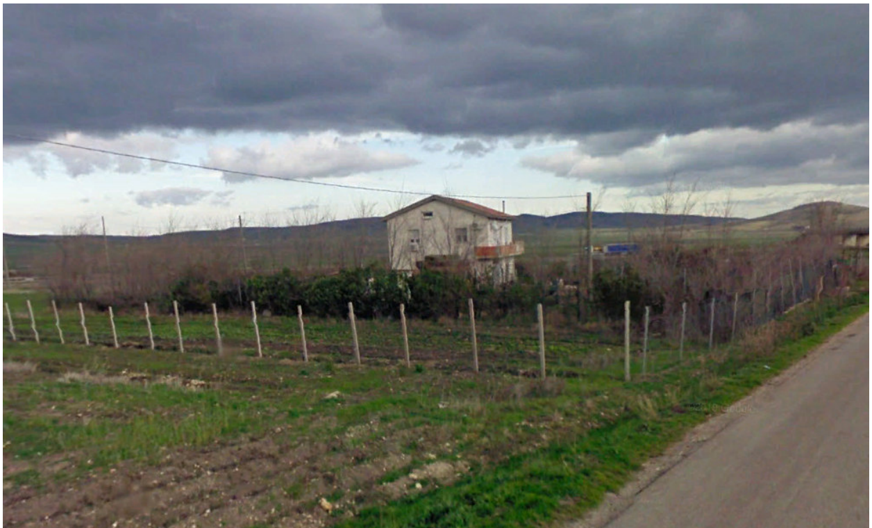
Alberature poderali di Ulmus minor e Thuja orientalis

Nell'area della Sottostazione Utente, in agro di Deliceto, son presenti alberature poderali e un'alberatura stradale, le prime costituite prevalentemente da alberi da frutto ( Ficus carica , ecc.) con pini ( Pinus spp. ) e cipressi ( Cupressus spp. ), la seconda da olmi ( Ulmus spp. ).