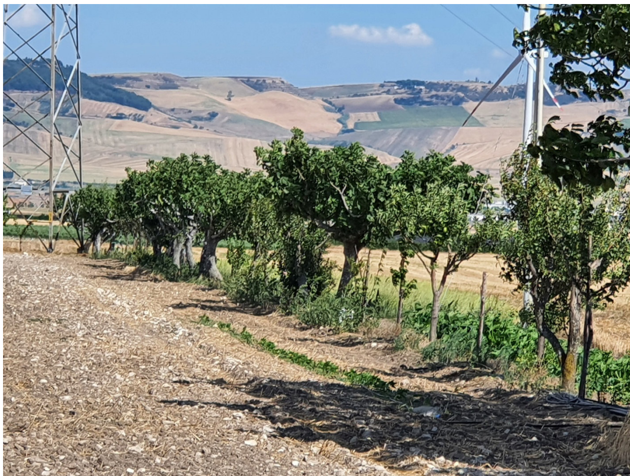
Alberatura poderale costituita da alberi da frutto ( Ficus carica , ecc.)