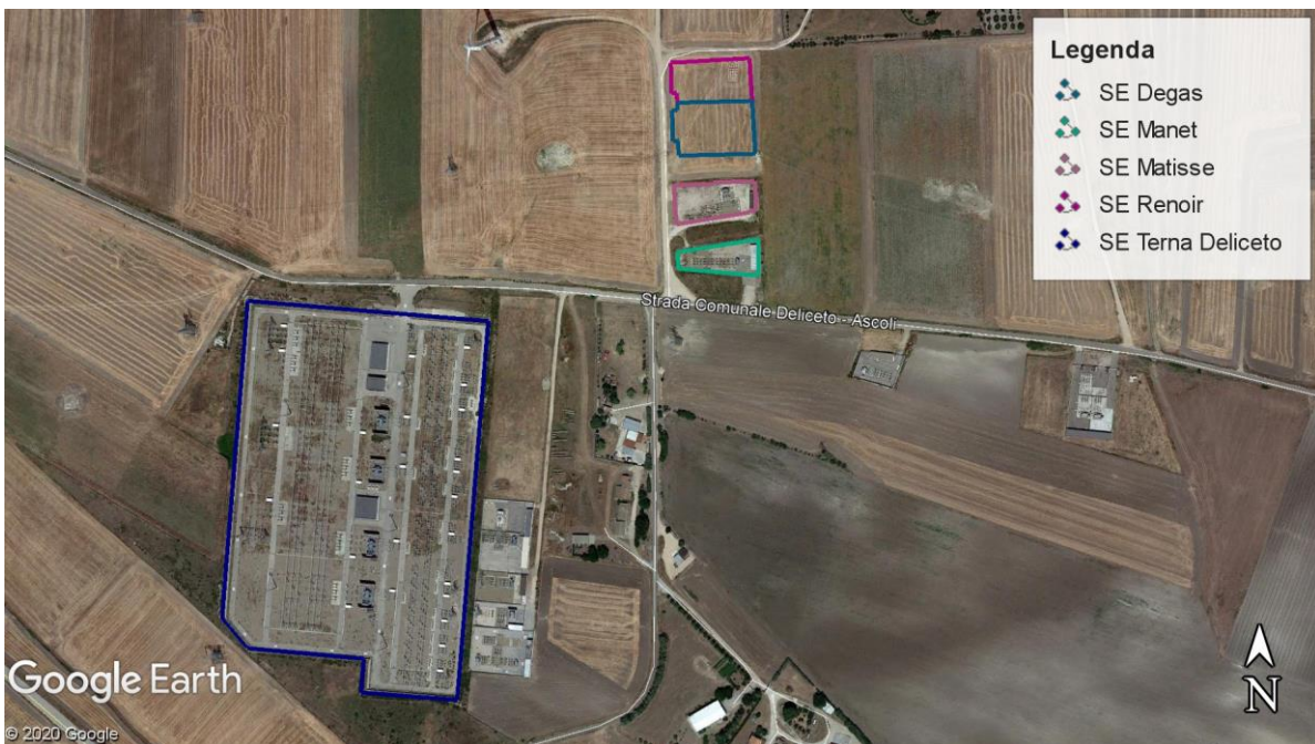
Inquadramento su ortfoto connessione