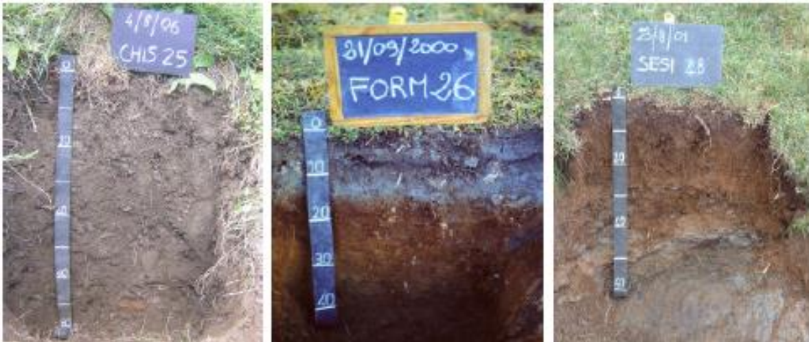
Esempi di scavi per rilevazione del profilo pedologico