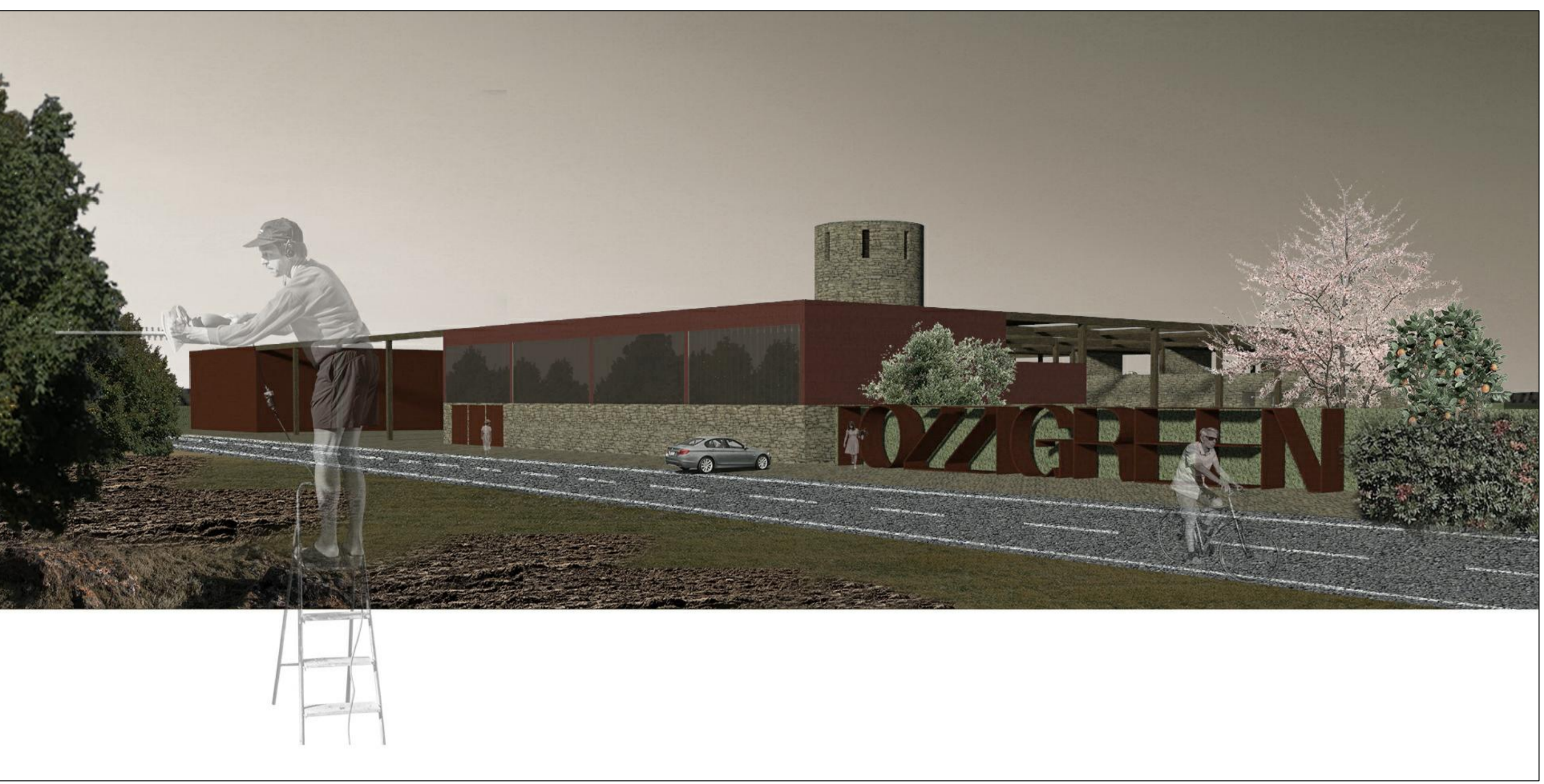
1 - vista verso il complesso dalla strada interpodereale a nord