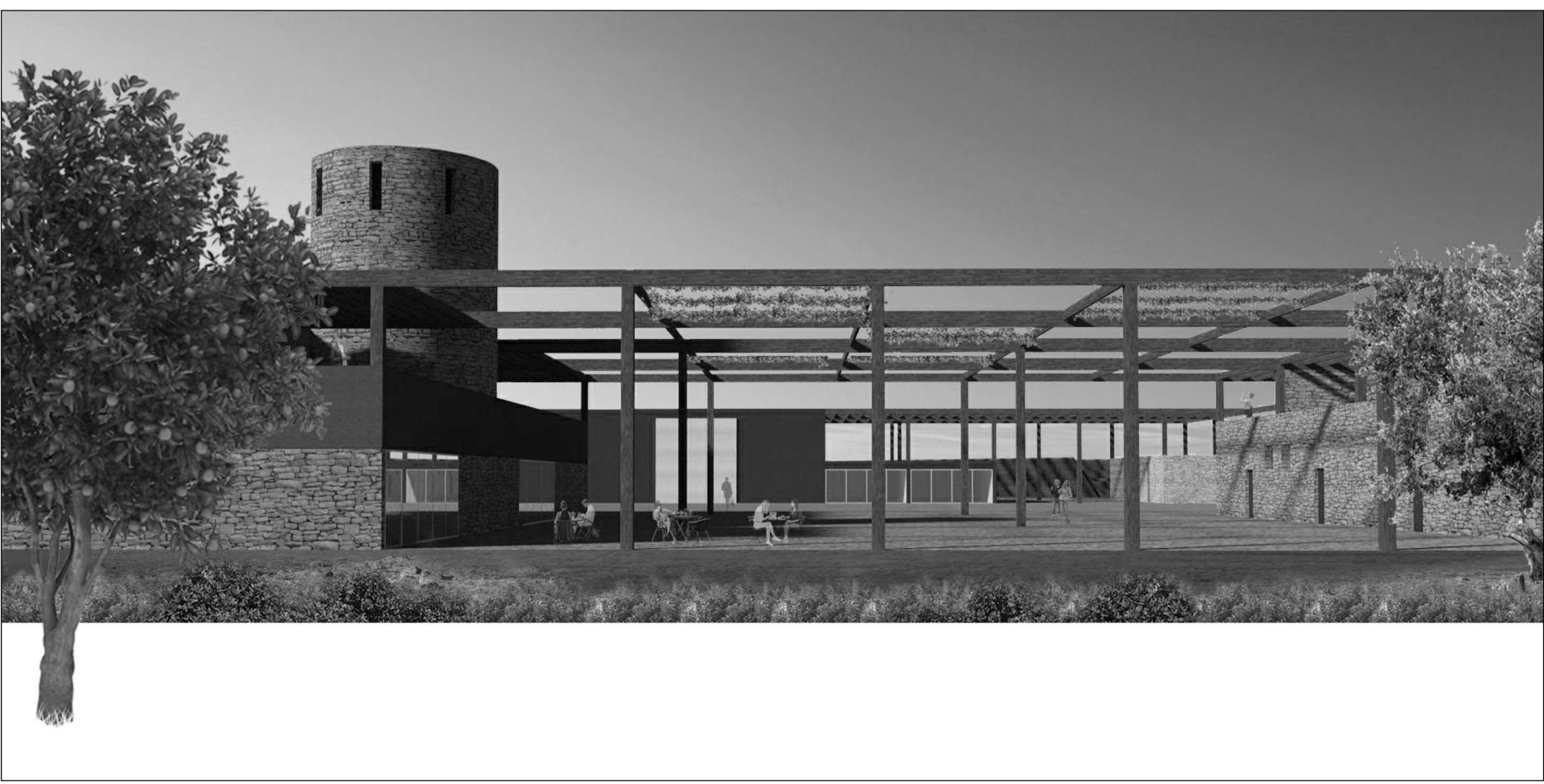
4 - vista dal lato ovest verso la piazza coperta