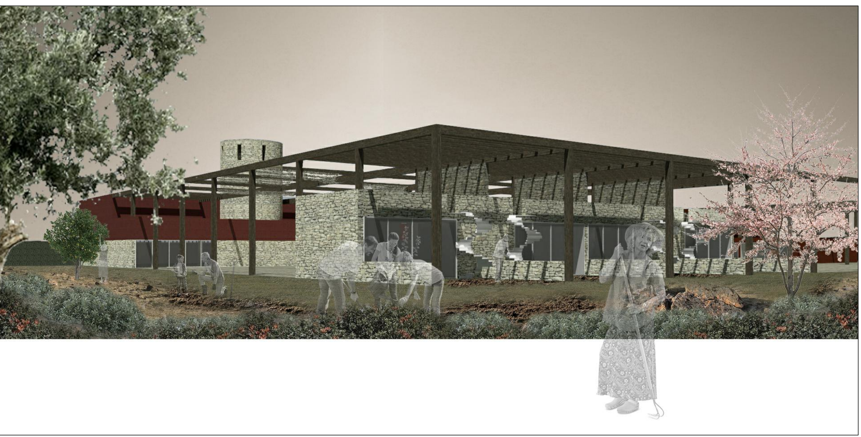
3 - vista verso le abitazioni dei manutentori