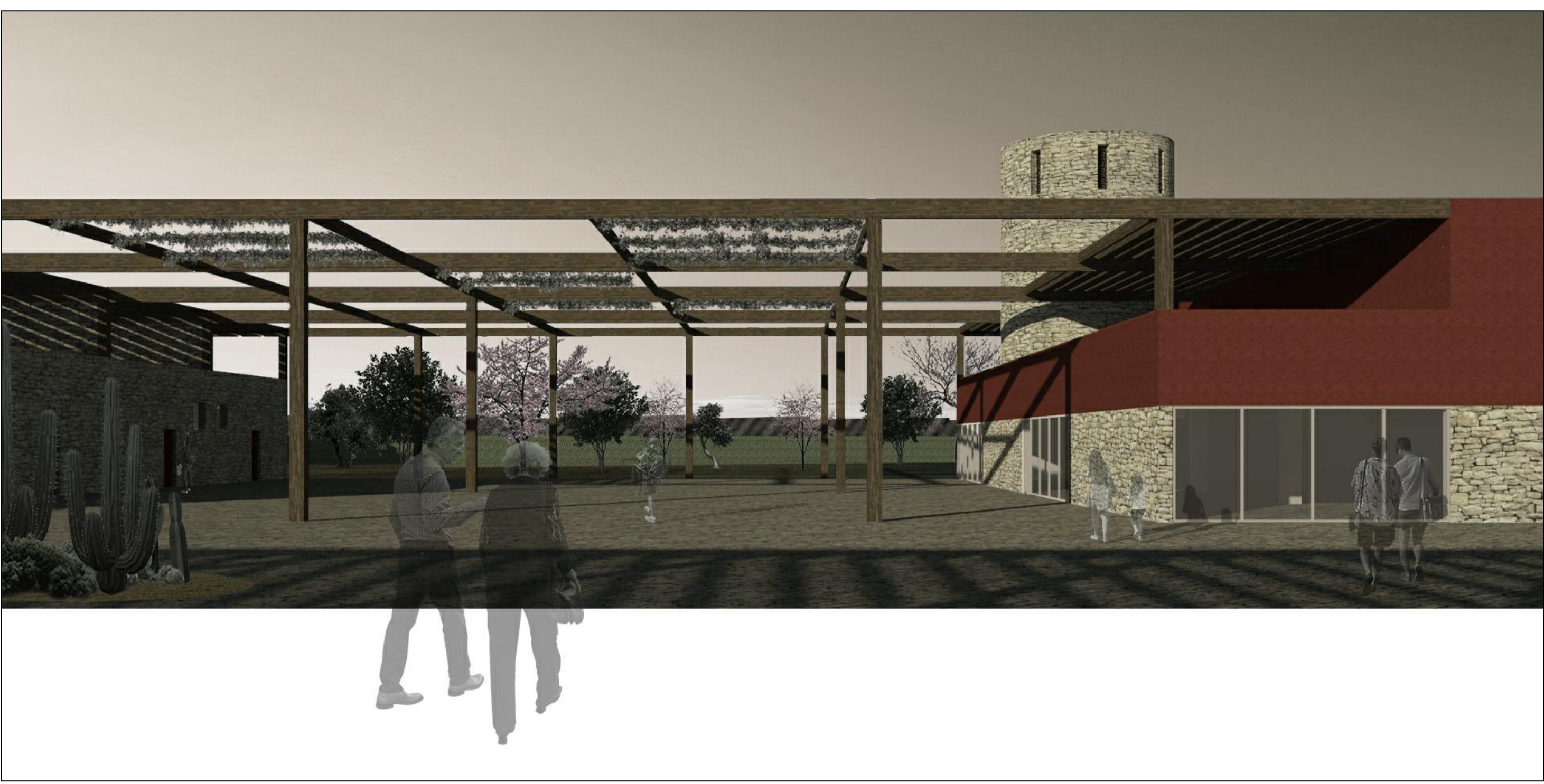
2 - vista dall'ia verso la piazza coperta