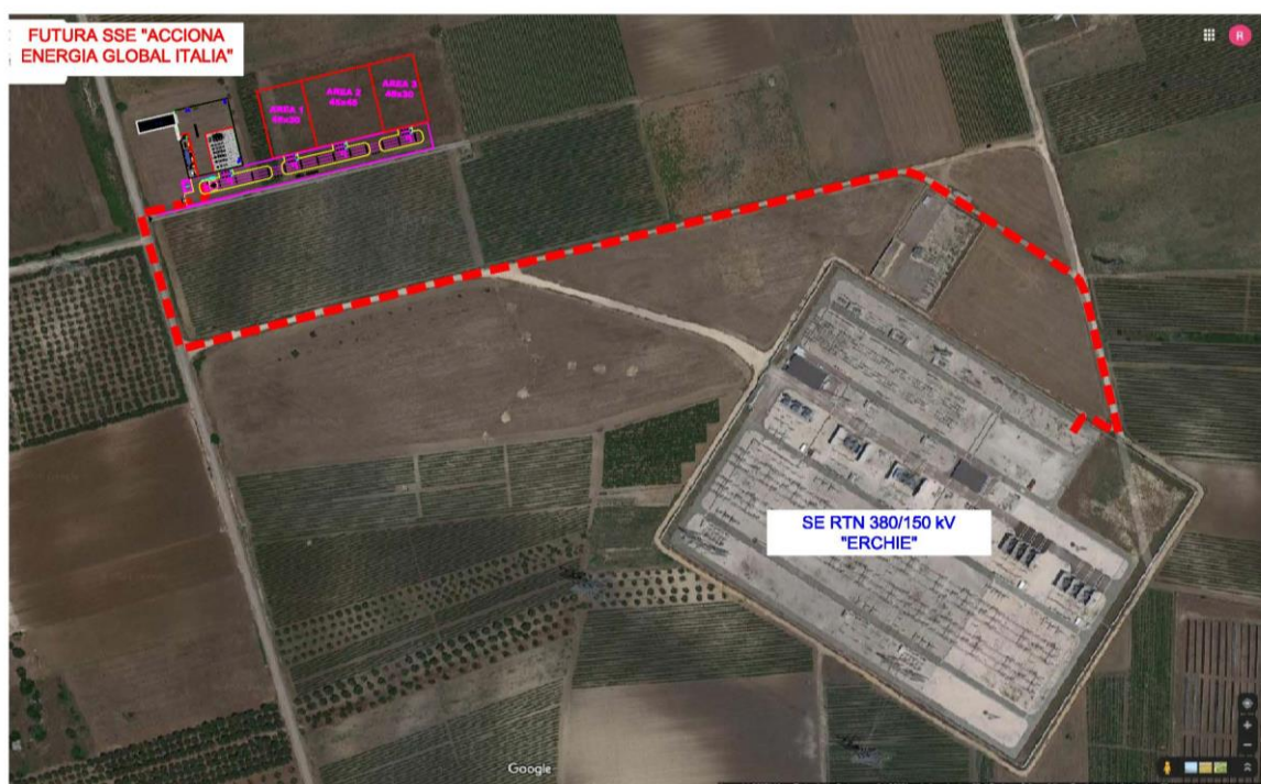
Figura 1: Ortofoto del percorso della linea elettrica in cavo

Di seguito si riporta una ortofoto della zona con il percorso dell'elettrodotto descritto.