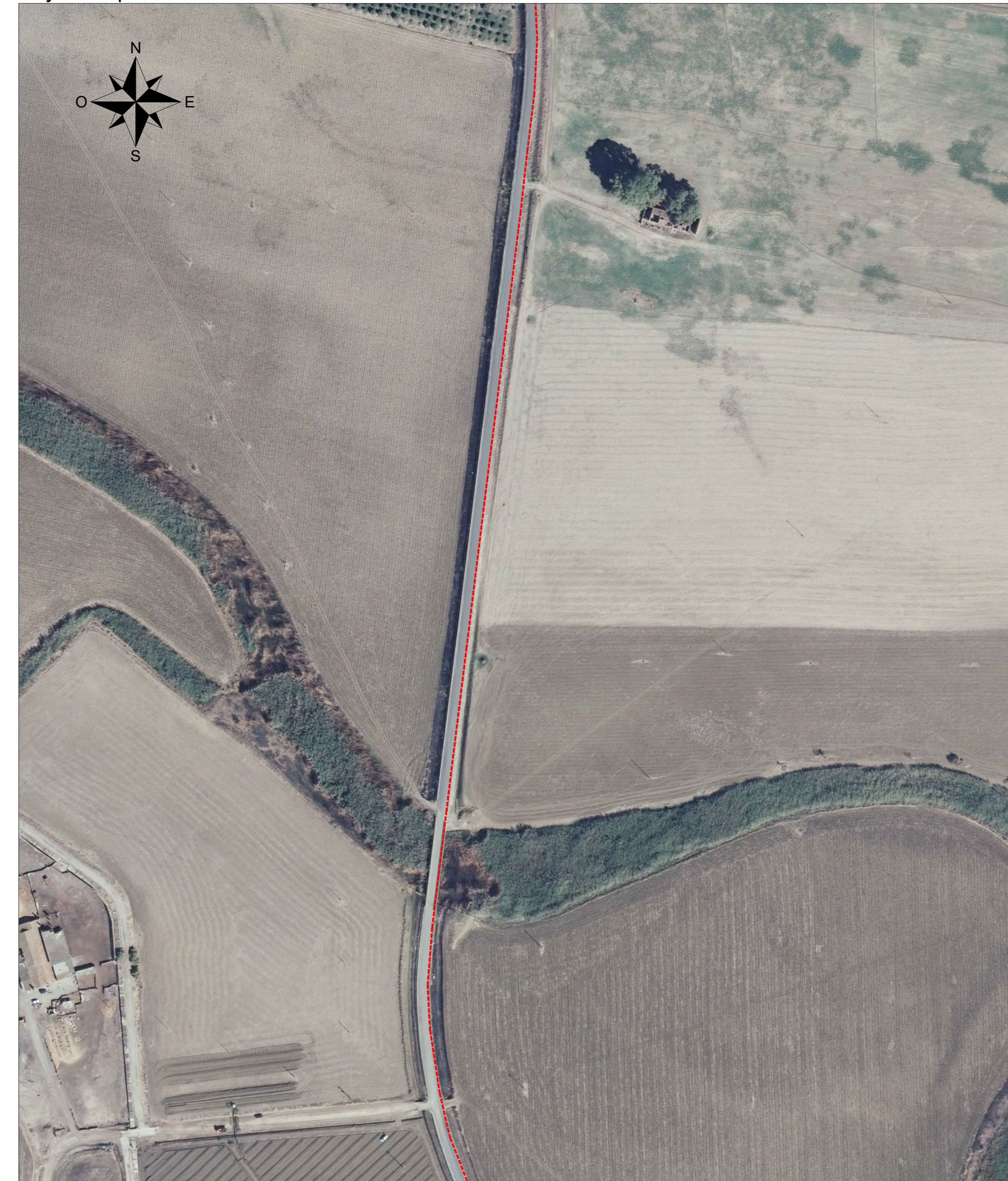
Layout impianto Vista F - scala 1:2000