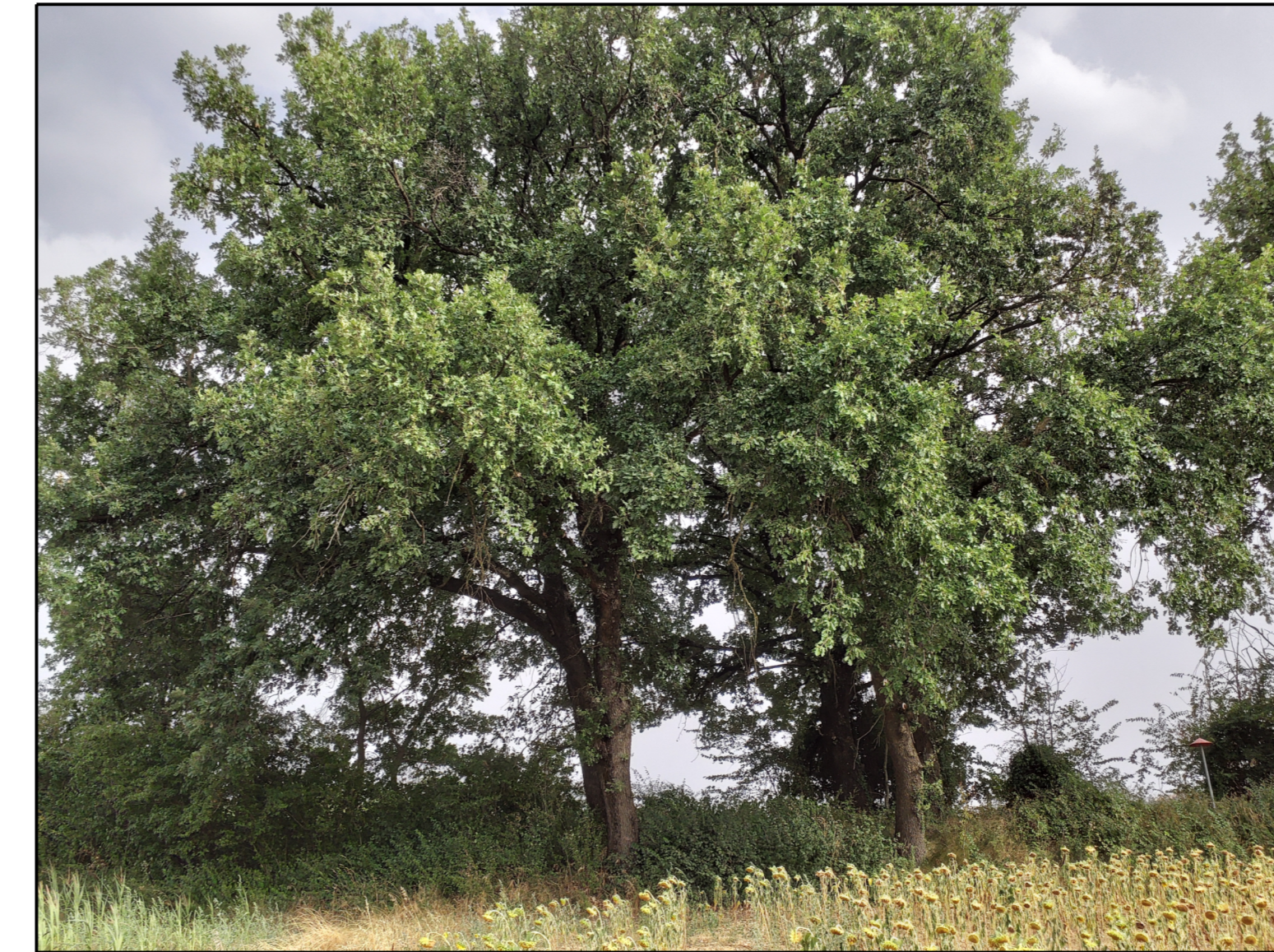
FOTO 1 - (P1-P2-P3-P4-P5) Quercus pubescens Diametro 70-57-60-80-54 cm