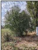
07/07/2018 ore 08:00