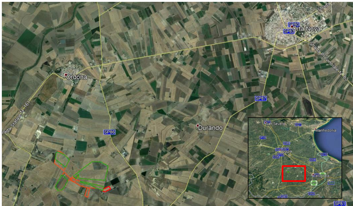
Figura 2.1: Localizzazione dell'area di intervento

La connessione dell'impianto avverrà tramite cavo interrato in MT fino alla cabina di trasformazione, posta a circa 1.2 km a Sud-Est del sito in esame, per poi proseguire in cavo AT, sempre lungo viabilità pubblica. Il percorso della connessione avrà una lunghezza totale di circa 19 Km. Il punto di allaccio è la sottostazione di trasformazione della RTN 150 kV di Stornara.