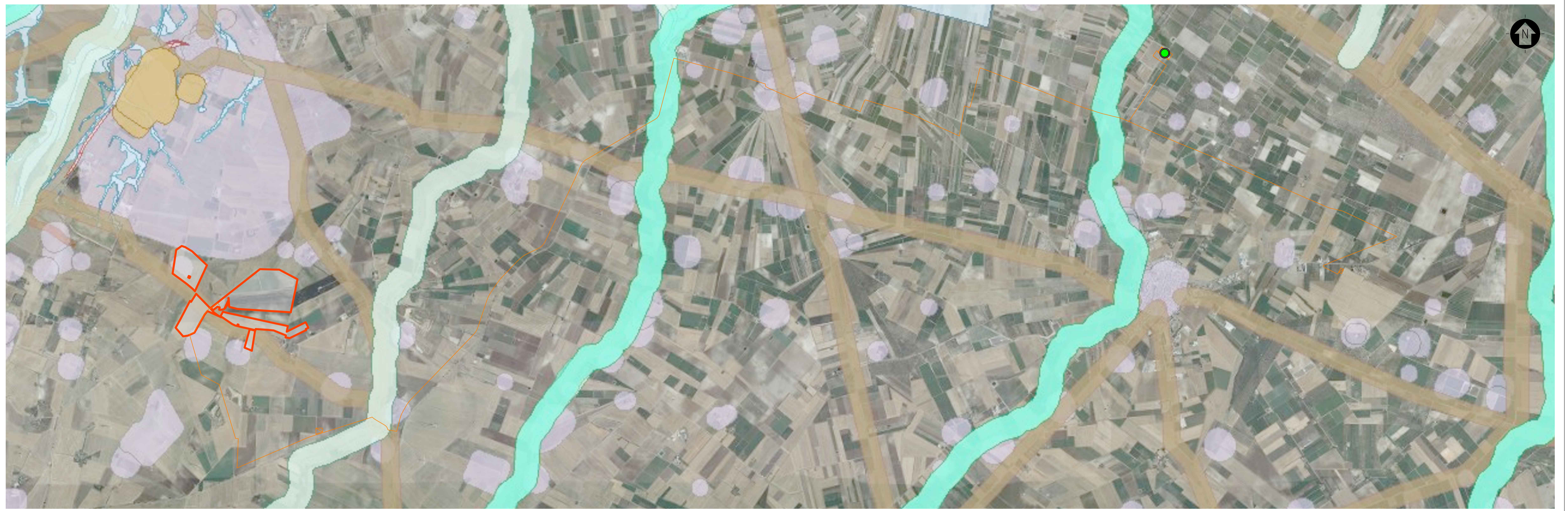
STRALCIO CARTOGRAFICO SISTEMA INFORMATIVO TERRITORIALE - REGIONE PUGLIA - IMPIANTI FER DGR2122