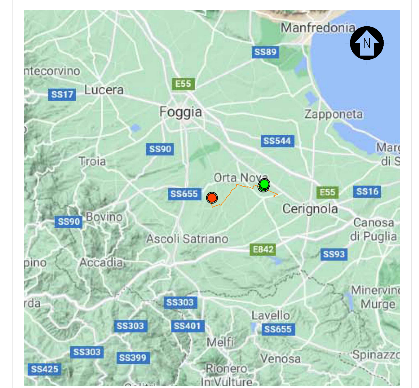
INQUADRAMENTO TERRITORIALE SCALA 1:500000 – 1 cm = 5 Km 0 5 10 25 Km 0 1 2 5 cm