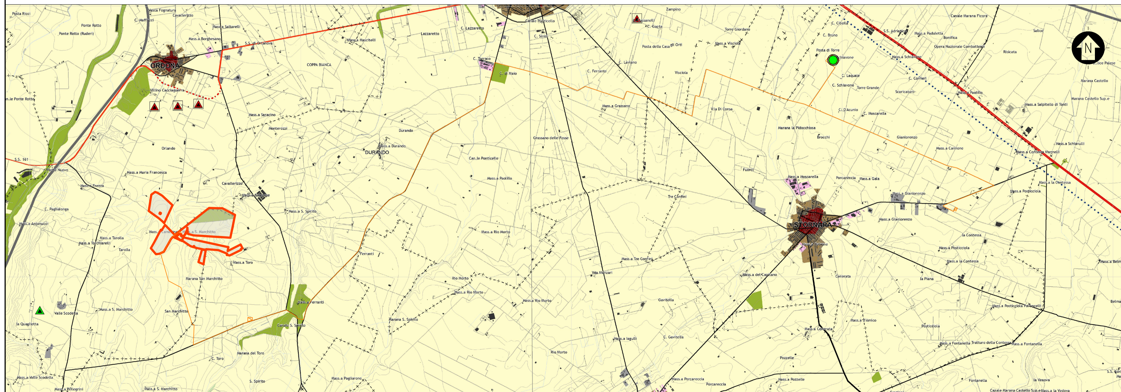
PIANO TERRITORIALE DI COORDINAMENTO DELLA PROVINCIA DI FOGGIA – STRALCIO CARTOGRAFICO TAVOLA C – ASSETTO TERRITORIALE SCALA ORIGINALE 1:25000 – FOGLIO 22, 23