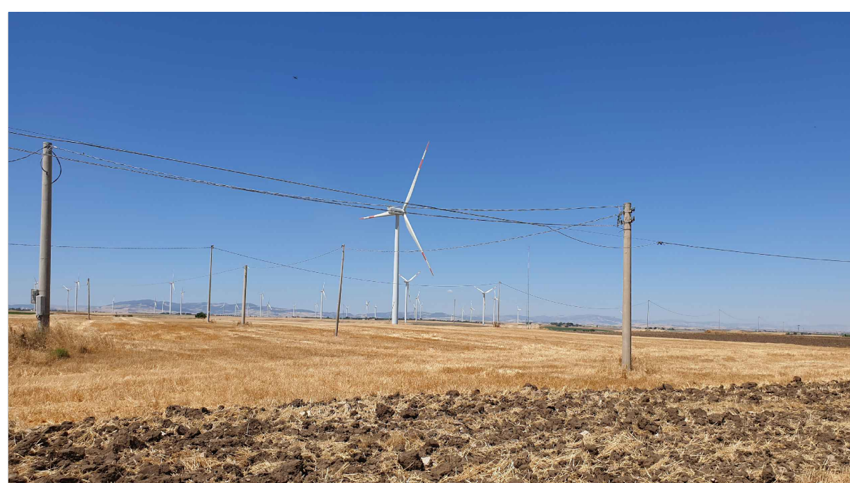
FOTOINSERIMENTO 5 - STATO DI FATTO