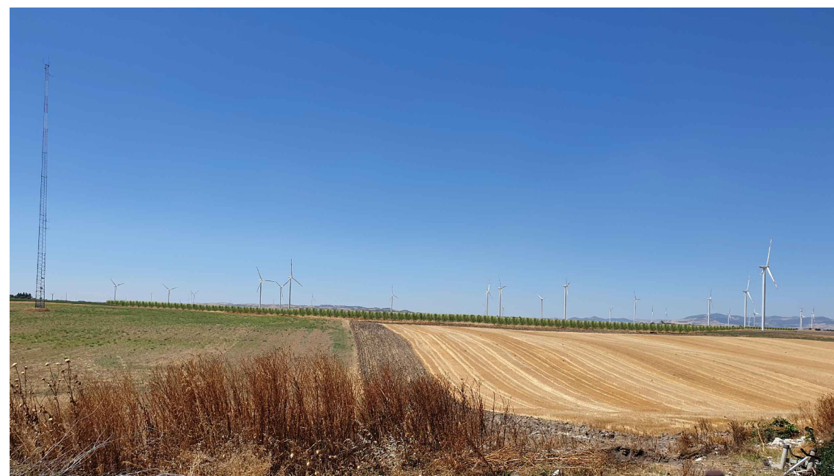
FOTOINSERIMENTO 4 - STATO DI PROGETTO