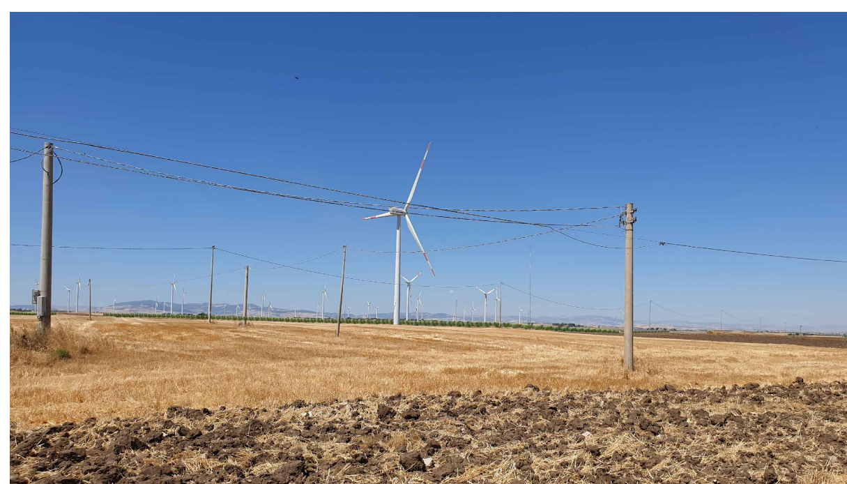
FOTOINSERIMENTO 5 - STATO DI PROGETTO