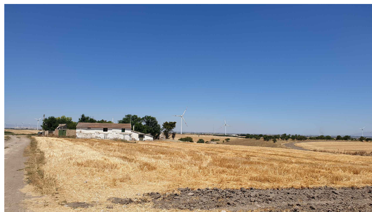
PUNTO DI PRESA FOTOGRAFICA 7