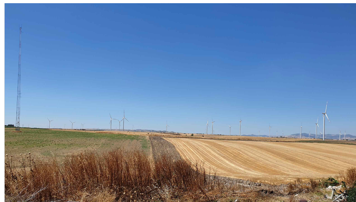
FOTOINSERIMENTO 4 - STATO DI FATTO