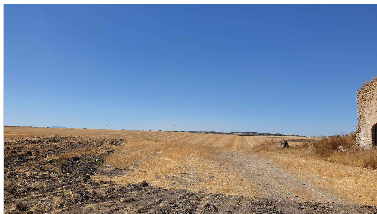
PUNTO DI PRESA FOTOGRAFICA 6