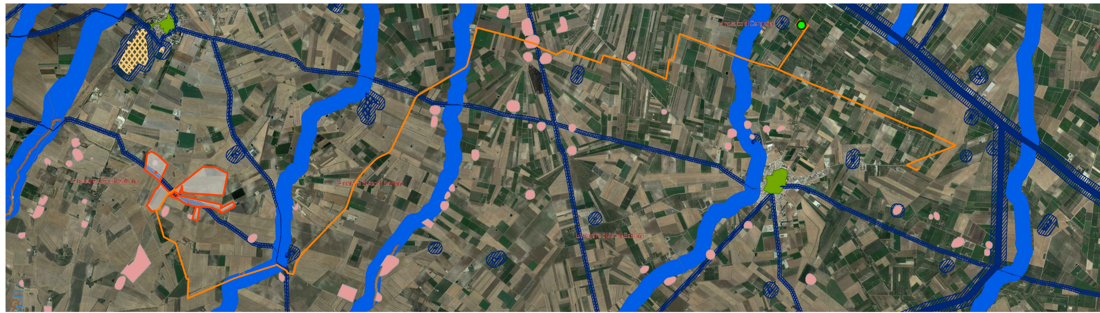
STRALCIO CARTOGRAFICO SISTEMA INFORMATIVO TERRITORIALE - REGIONE PUGLIA - PIANO PAESAGGISTICO TERRITORIALE REGIONALE