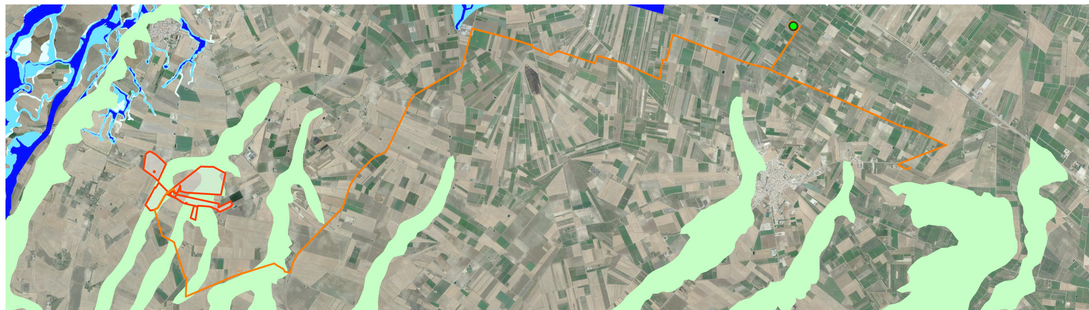
STRALCIO CARTOGRAFICO SISTEMA INFORMATIVO TERRITORIALE - REGIONE PUGLIA - PIANO STRALCIO PER L'ASSETTO IDROGEOLOGICO