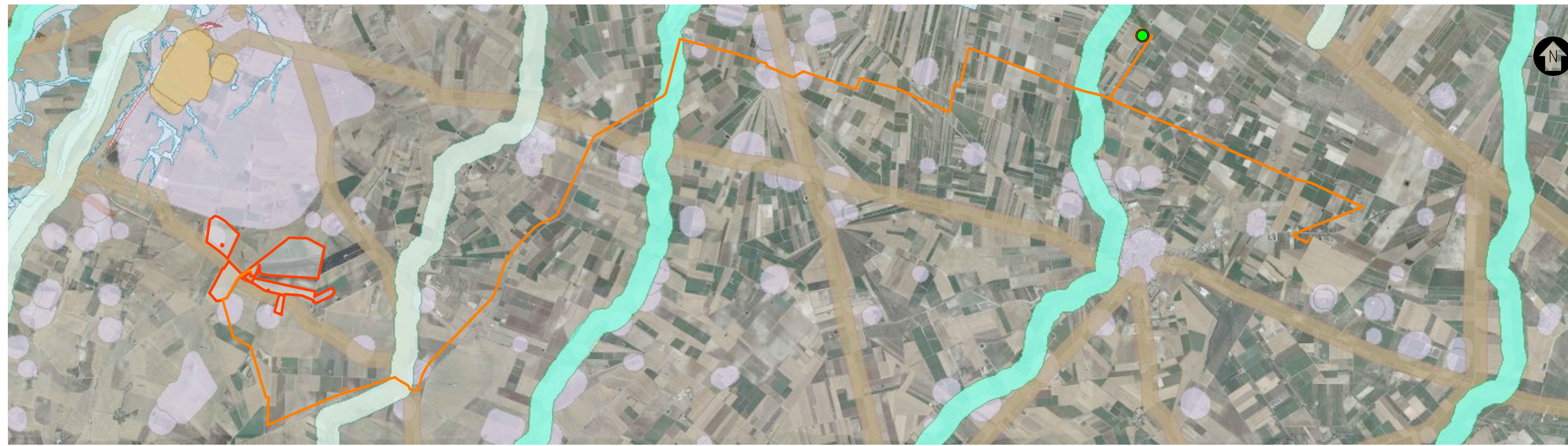
STRALCIO CARTOGRAFICO SISTEMA INFORMATIVO TERRITORIALE - REGIONE PUGLIA - IMPIANTI FER DGR2122