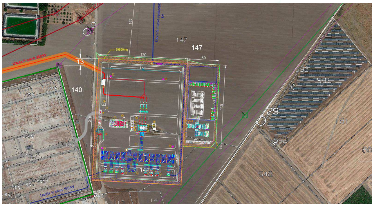
Area S.S.E.U. - Inquadramento Catastale

L'area individuata è identificata al N.C.T. di Foggia nel foglio di mappa 37 particelle 147 come rappresentato nella tavola allegata.