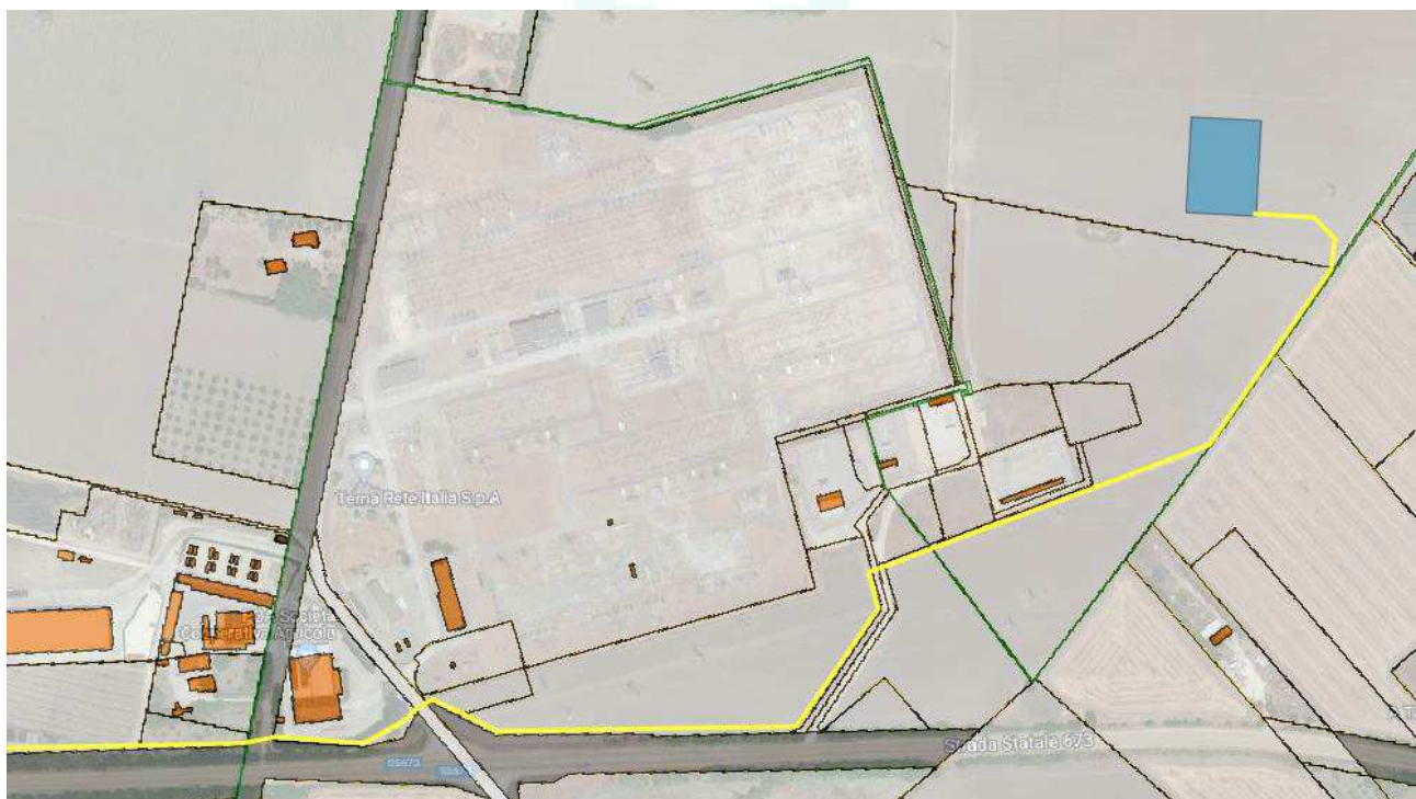
Figura 3-3: Inquadramento Catastale SSEU, in blu le aree contrattualizzate, in grigio le aree da assoggettare all'esproprio per la viabilità