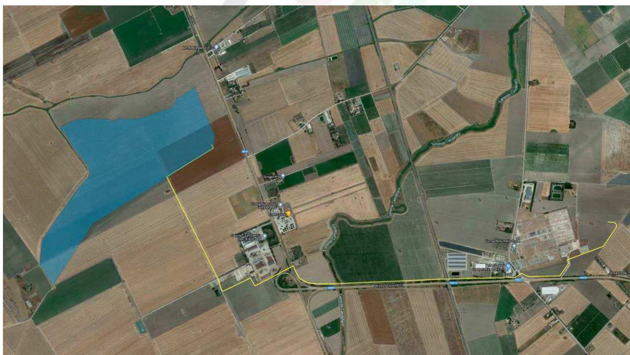
Figura 3-1: Localizzazione area di intervento, in blu la perimetrazione del sito, in giallo il tracciato della connessione

L'impianto fotovoltaico in progetto, del tipo "Utility Scale" e sito nel Comune di Foggia (FG), della potenza di 30 MWn si connette alla Rete Elettrica Nazionale mediante la Stazione Elettrica a 380/150 kV di Foggia attraverso un elettrodotto in cavo interrato della lunghezza di circa 4,45 Km.