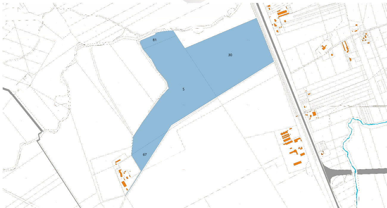
Area Impianto - Inquadramento Catastale

In particolare, l'area oggetto di compravendita è pari a circa 78,5001 Ha.