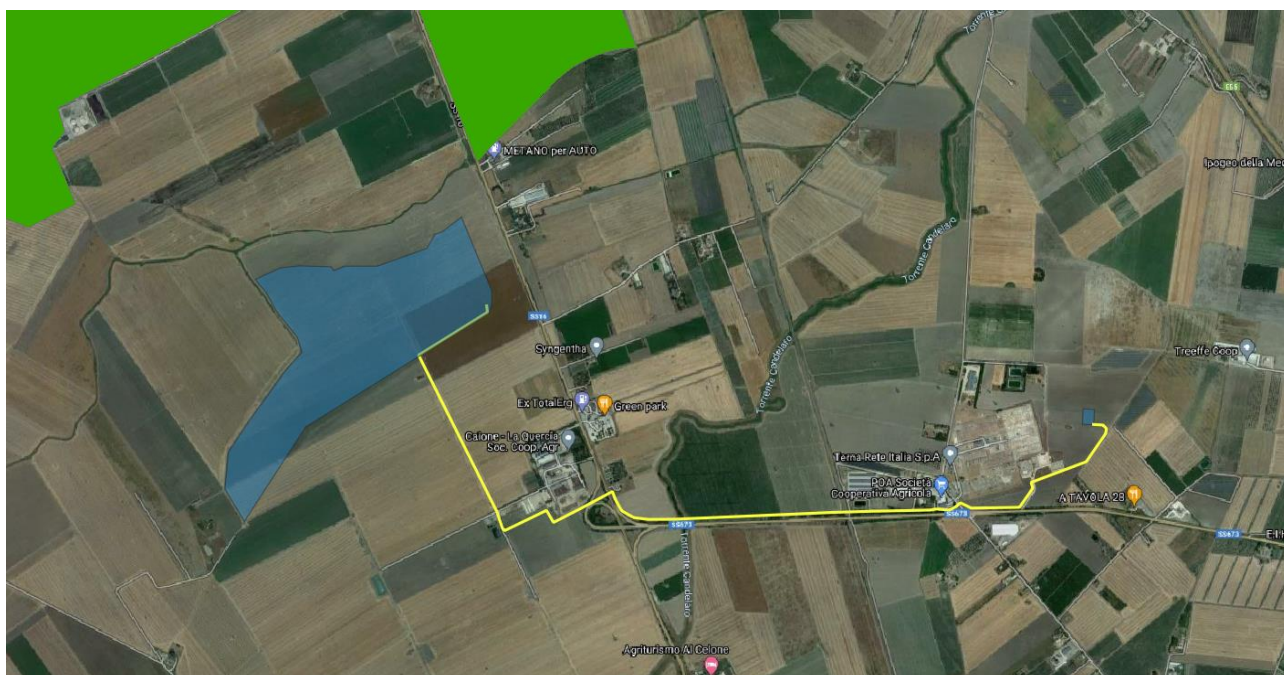
Figura 2-1: PTA: Aree Sottoposte a Specifica Tutela, in blu la perimetrazione del sito, in giallo il tracciato della connessione