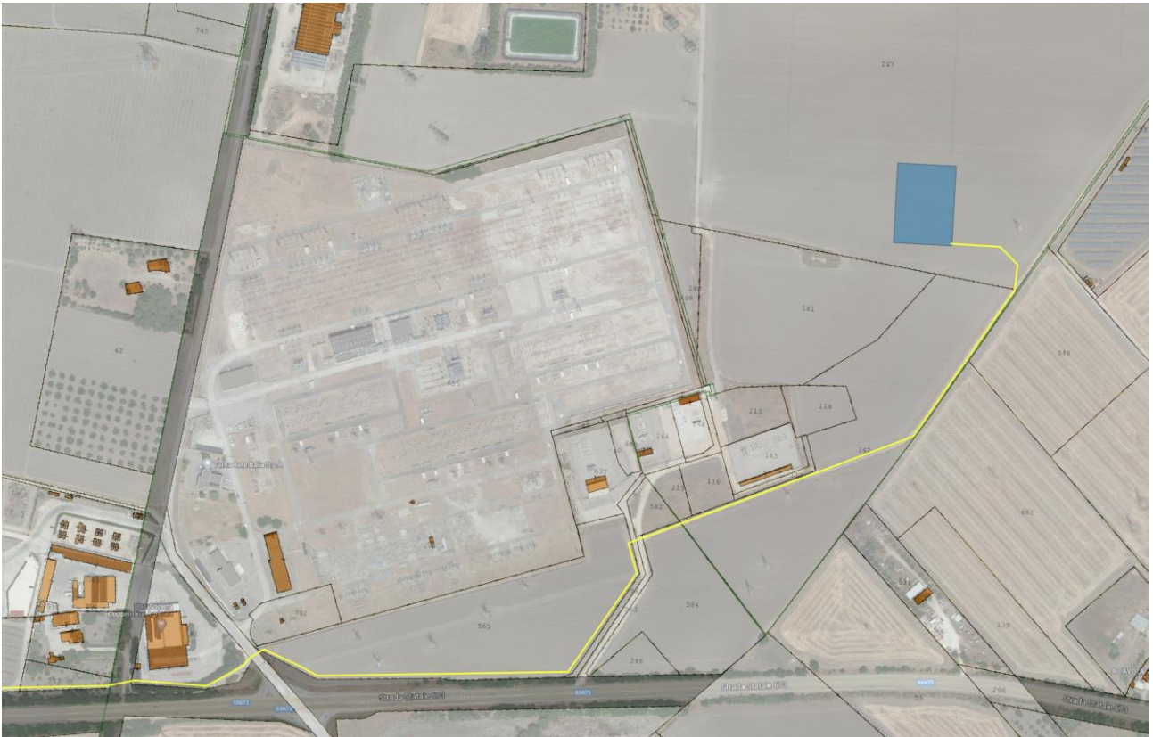
Figura 3-3: Inquadramento Catastale SSEU, in blu le aree contrattualizzate, in grigio le aree da assoggettare all'esproprio per la viabilità

Progettista: Ing. Marco Gennaro Balzano Ordine Degli Ingegneri Della Provincia Di Bari N. 9341