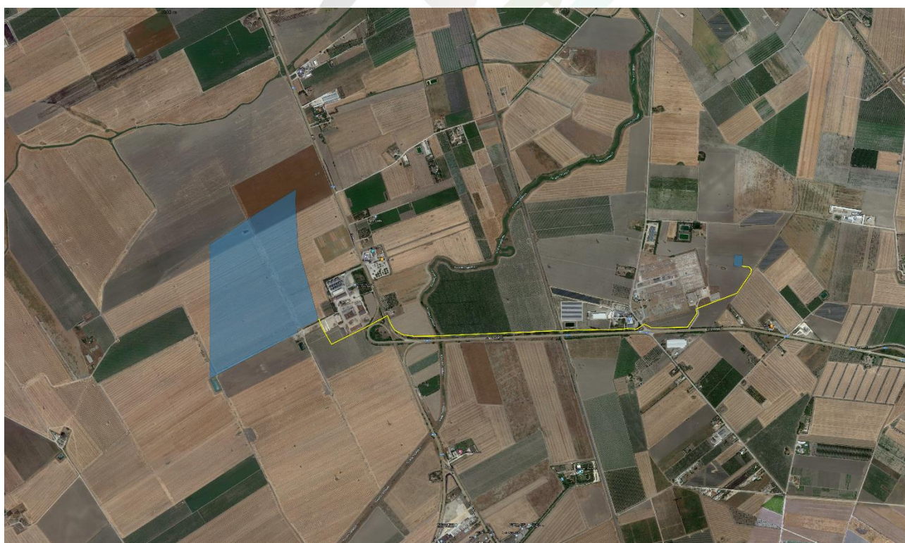
Figura 3-1: Localizzazione area di intervento, in blu la perimetrazione del sito, in giallo il tracciato della connessione

L'impianto fotovoltaico in progetto, del tipo "Utility Scale" e sito nel Comune di Foggia (FG), della potenza di 30 MWn si connette alla Rete Elettrica Nazionale mediante la Stazione Elettrica a 380/150 kV di Foggia attraverso un elettrodotto in cavo interrato della lunghezza di circa 3,32 Km.