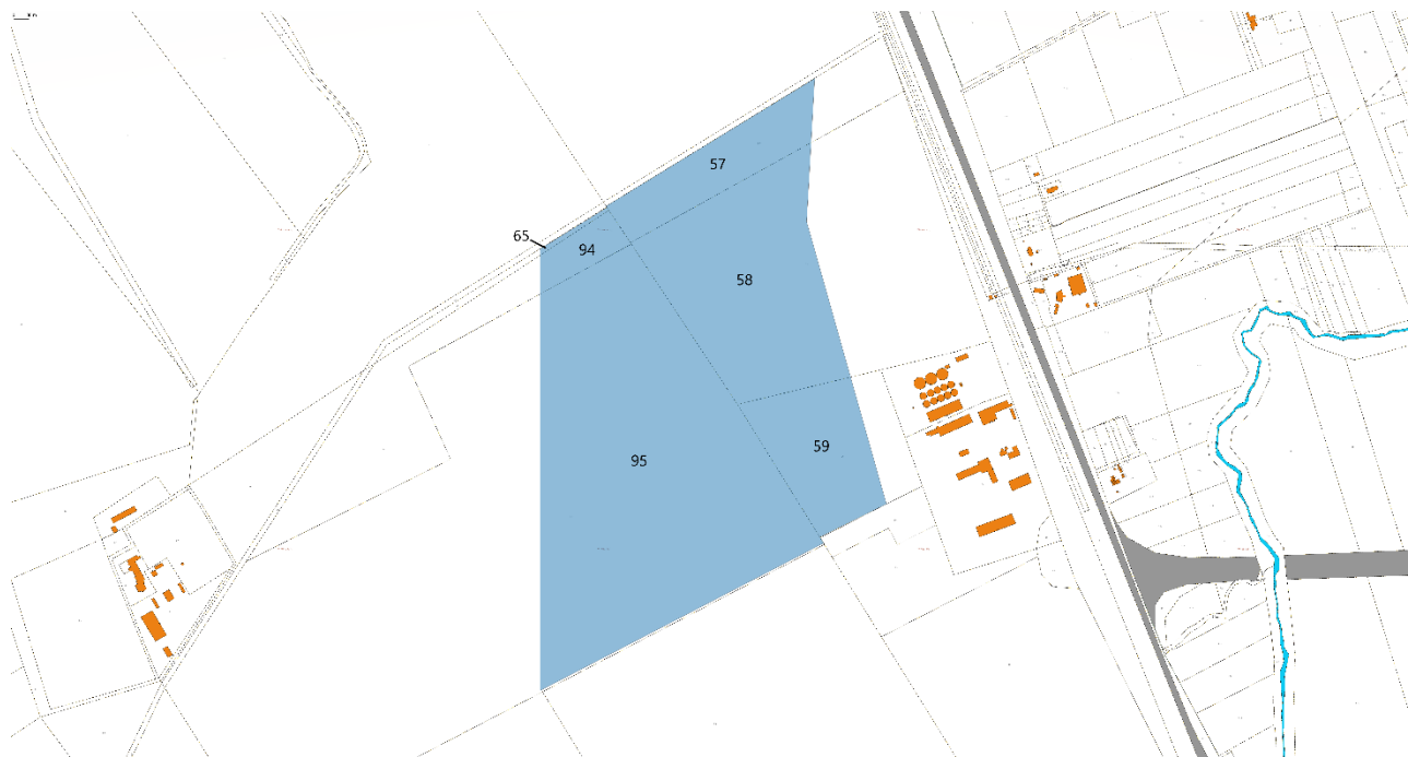
Figura 3-2: Inquadramento Catastale Parco Fotovoltaico