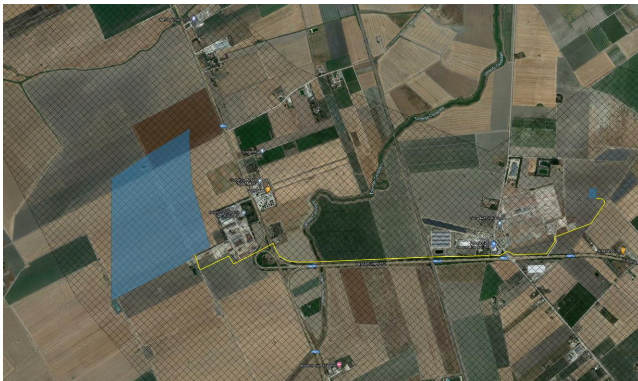
Figura 8-2: PTA - Aree Ulteriori, in blu la perimetrazione del sito, in giallo il tracciato della connessione