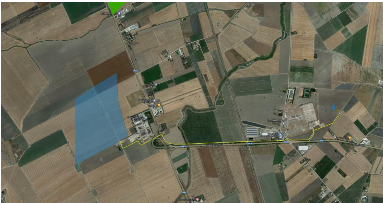
Figura 8-1: PTA: Aree Sottoposte a Specifica Tutela, in blu la perimetrazione del sito, in giallo il tracciato della connessione