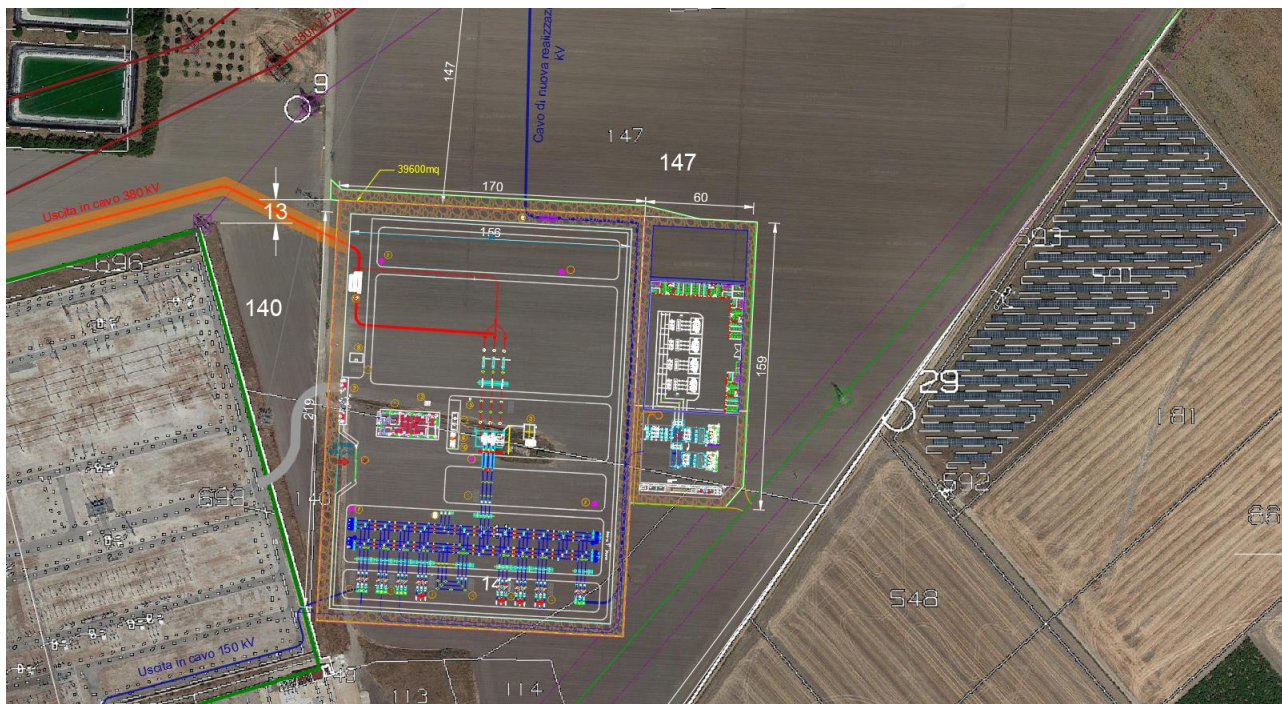
Area S.S.E.U. - Inquadramento Catastale

L'area individuata è identificata al N.C.T. di Foggia nel foglio di mappa 37 particelle 147 come rappresentato nella tavola allegata.