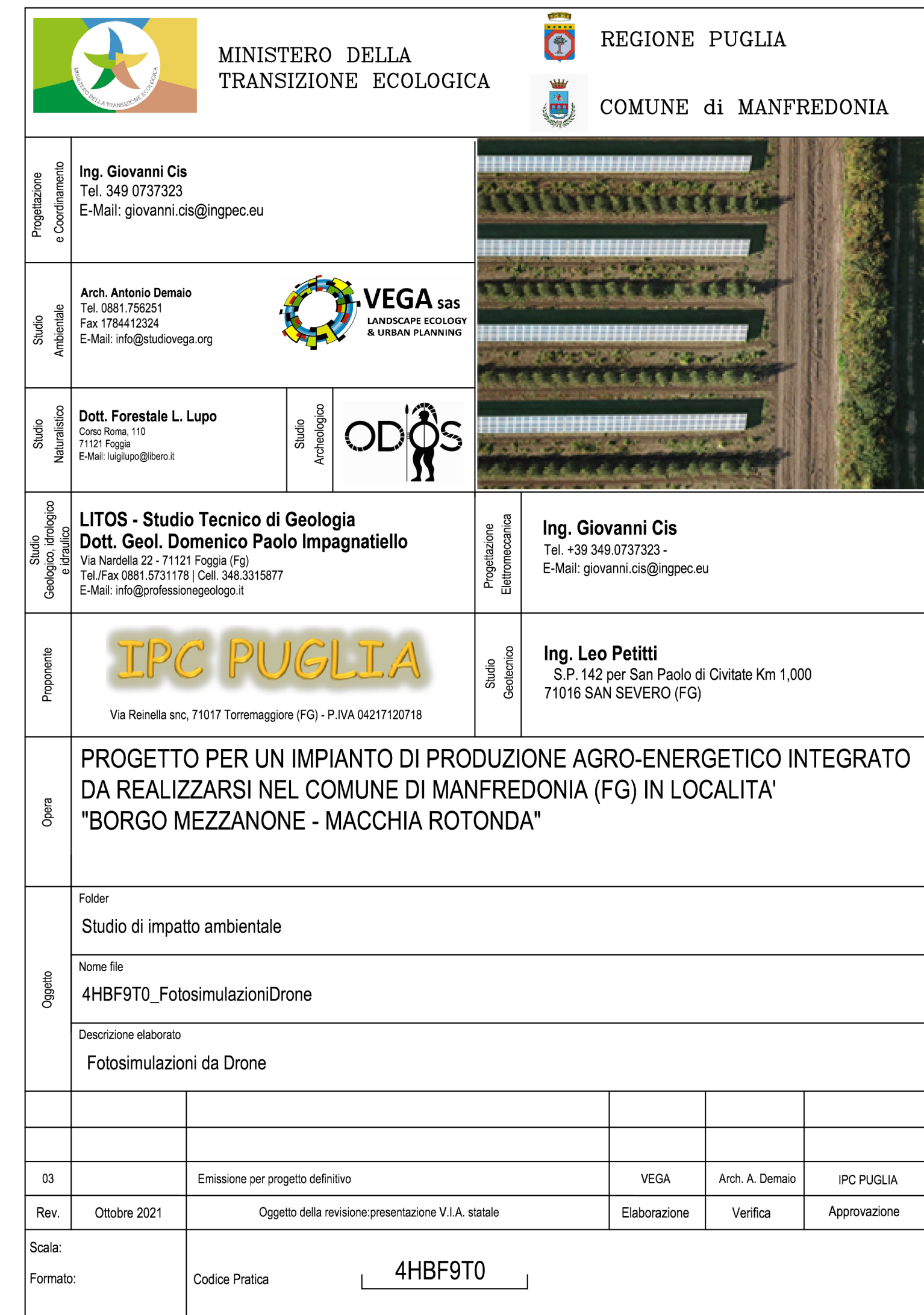
1 - Panoramica da Ovest