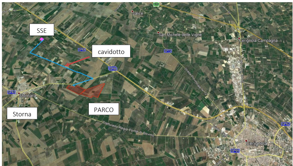
Figura 2.1: Localizzazione dell'Area di Intervento, in rosso l'area recintata, in blu la linea di connessione

La connessione dell'impianto è realizzata tramite elettrodotto interrato in AT. I cavi saranno stesi dalla cabina di trasformazione interna al parco fino sottostazione elettrica della RTN 150 kV ubicata a circa 2 km a NNE di Stornara. Il percorso del cavidotto avrà una lunghezza di circa 6 km e sarà posizionato ai margini della viabilità pubblica esistente (S.P.88, strada comunale Contessa e strada vicinale Schiavone).