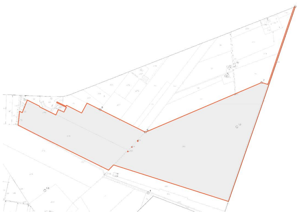
Figura 3: Inquadramento catastale.