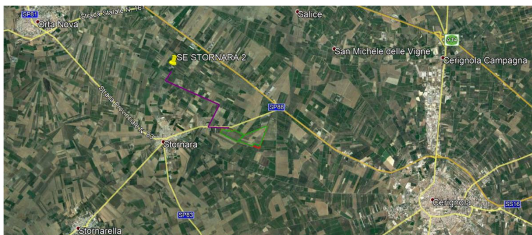
Figura 2: Inquadramento territoriale area di progetto: in verde recinzione dell'impianto, in blu linea di connessione.

Dal riferimento del Catasto Terreni del Comune di Stornara, l'impianto occupa le aree riferite al Foglio 13.