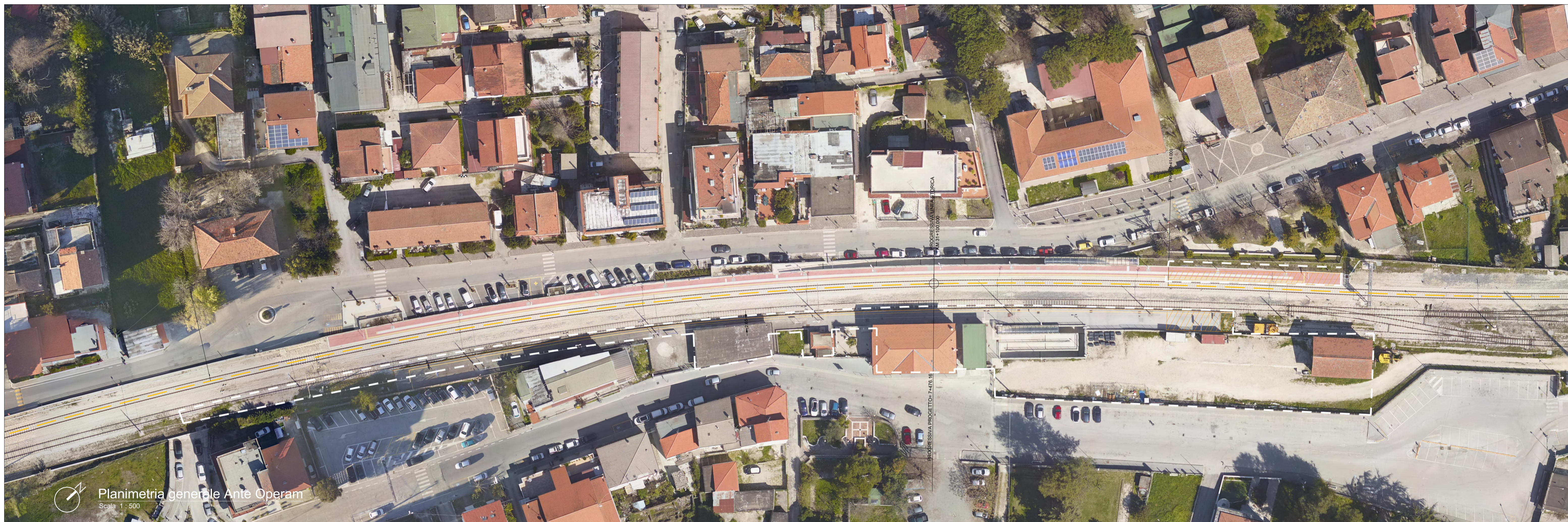
Planimetria generale Ante Operam Scala 1:500