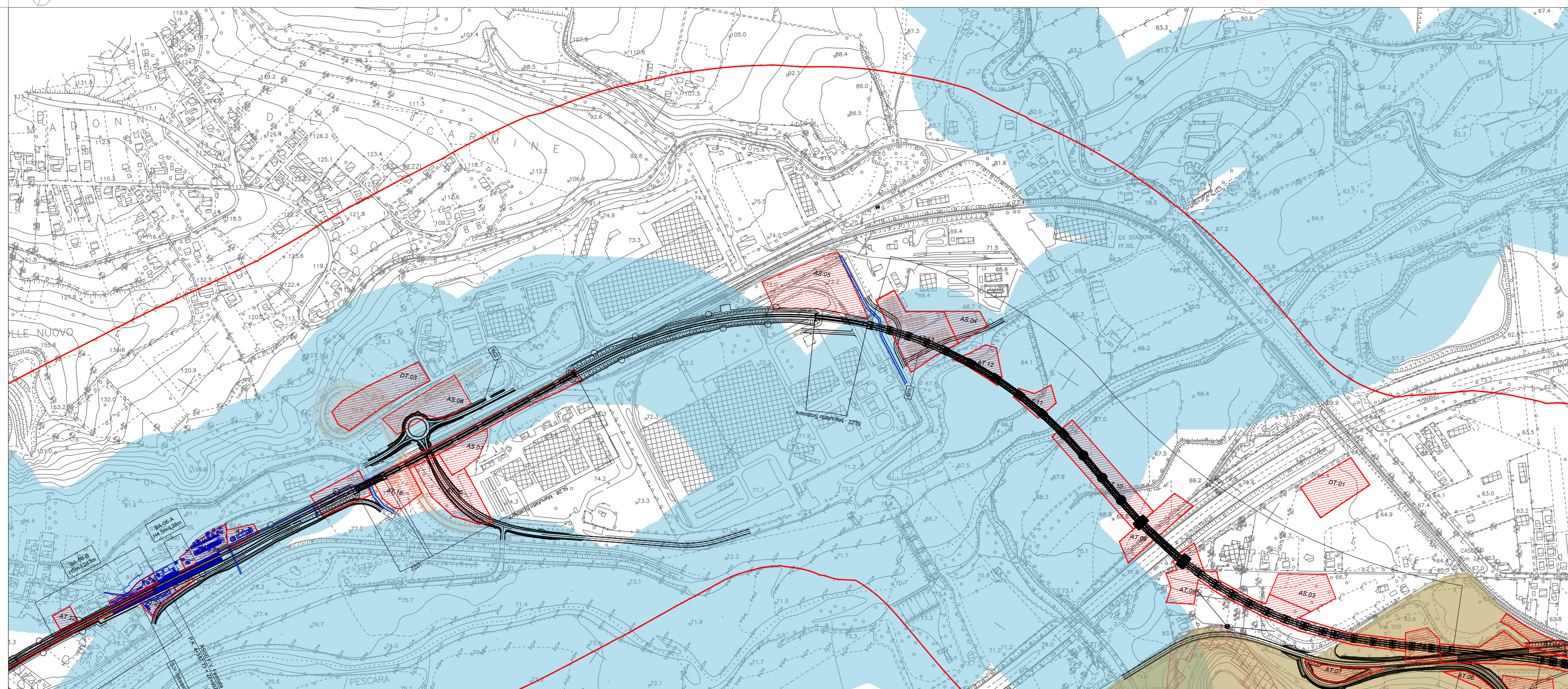
TRATTO B- CARTA DEI VINCOLI E DELLE TUTELE