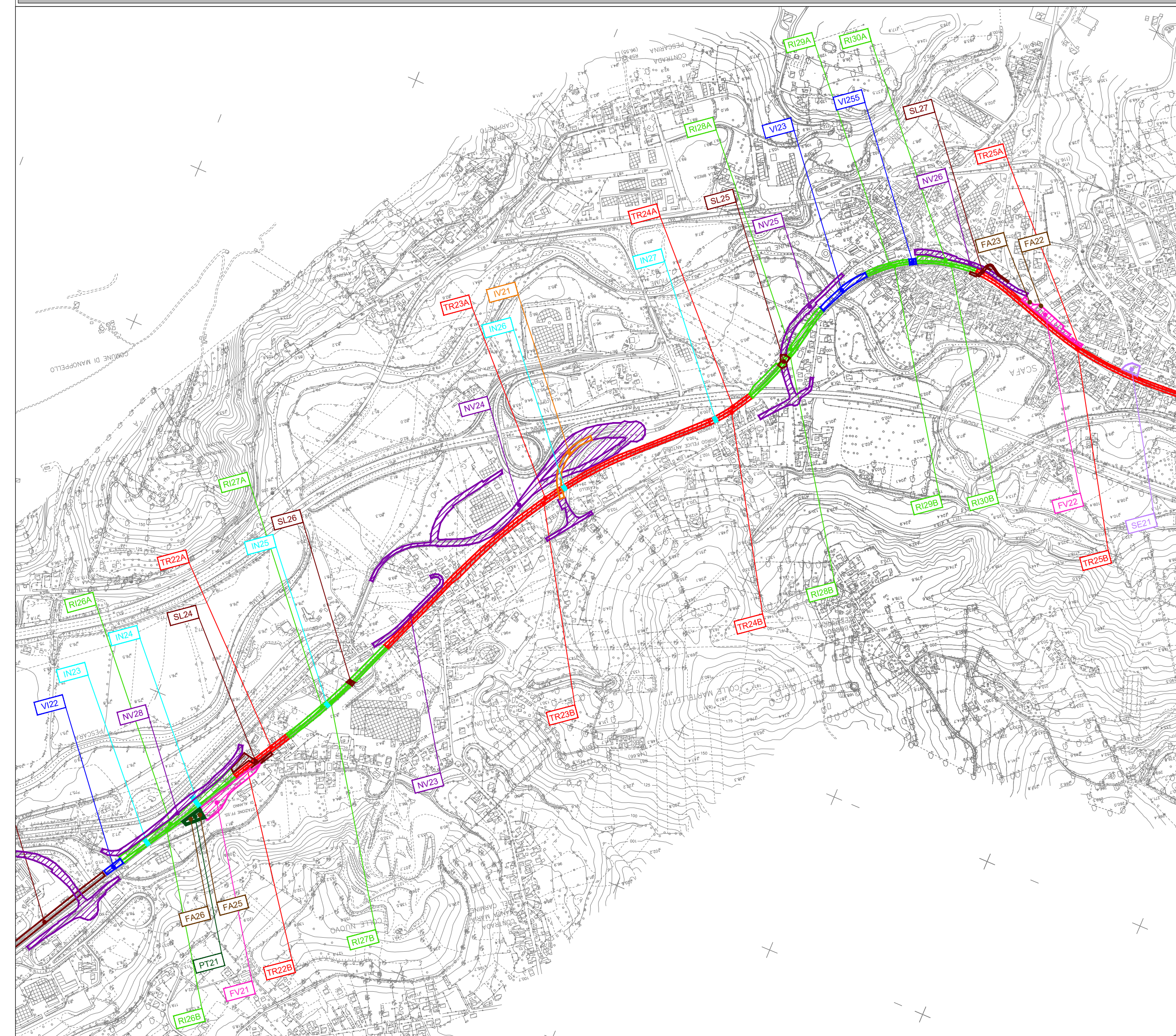
KEY PLAN WBS - PLANIMETRIA INDIVIDUAZIONE WBS LOTTO 1 - SCALA 1:10.000