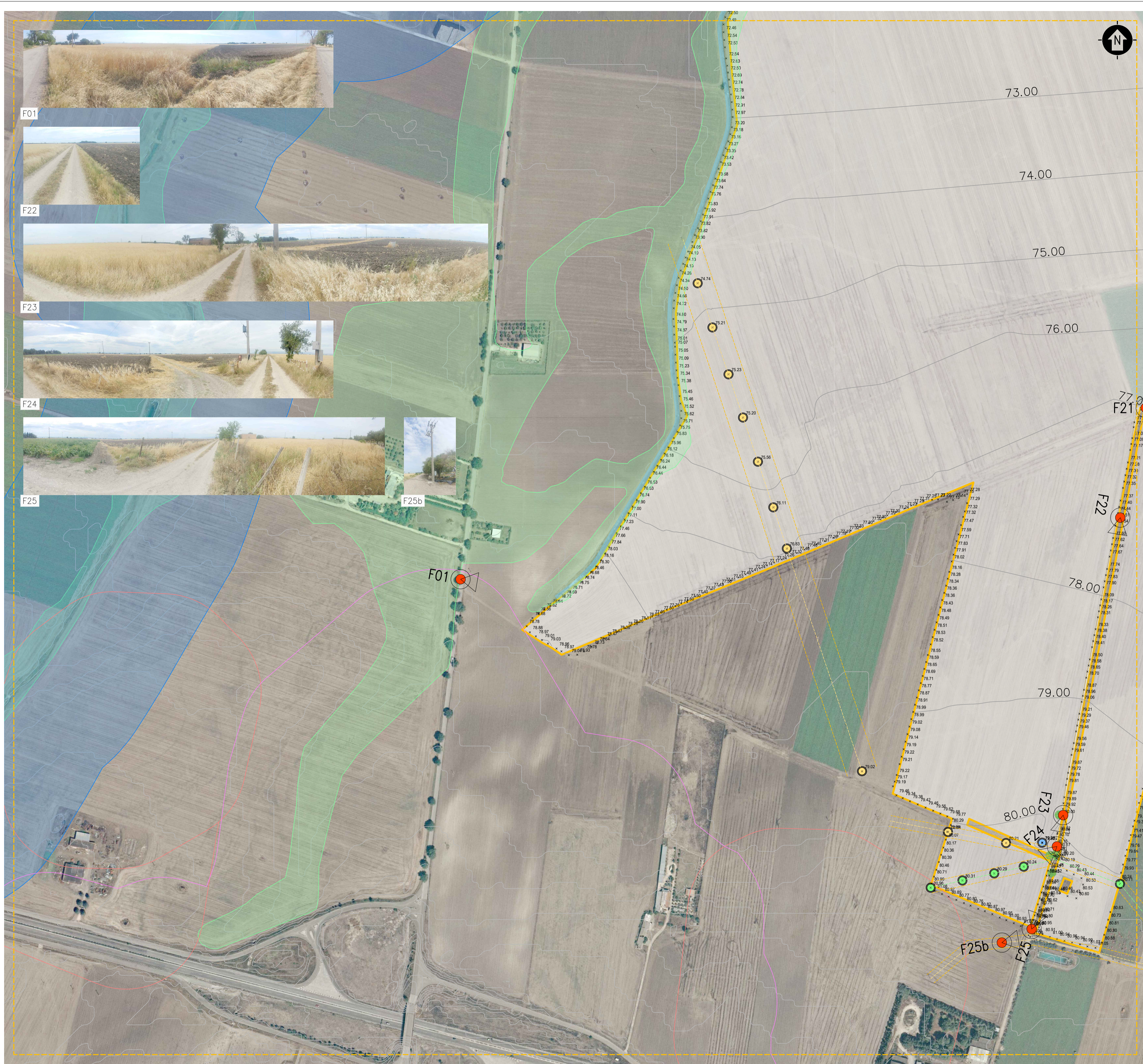
DETTAGLIO CARTOGRAFICO - AREA SUD-OVEST