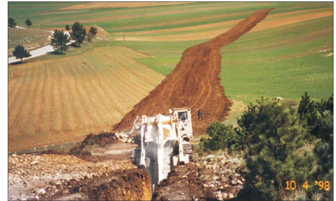
SCAVO DELLA TRINCEA