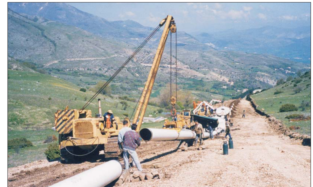
SFILAMENTO E ASSIEMAGGIO