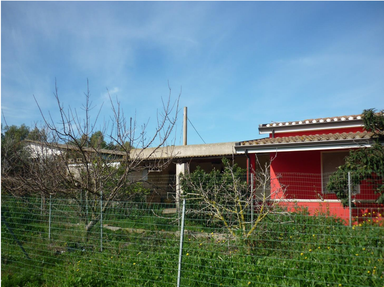
Figura 3: Ricettore REC48

Il fabbricato oggetto di verifica è costruito con un solo piano fuori terra con copertura a falde, costruito in pietra granitica. Le fondazioni sono ipotizzate come cordoli in pietra a contorno del perimetro portante dell'edificio. Utilizzato come fabbricato per attività agricole e prevalentemente per ricovero di attrezzature agricole e deposito.