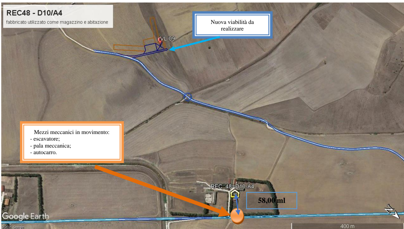
Figura 1: scenario n.1 adeguamento viabilità

Individuazione dei ricettori maggiormente esposti e della disposizione dei macchinari nelle due fasi lavorative: