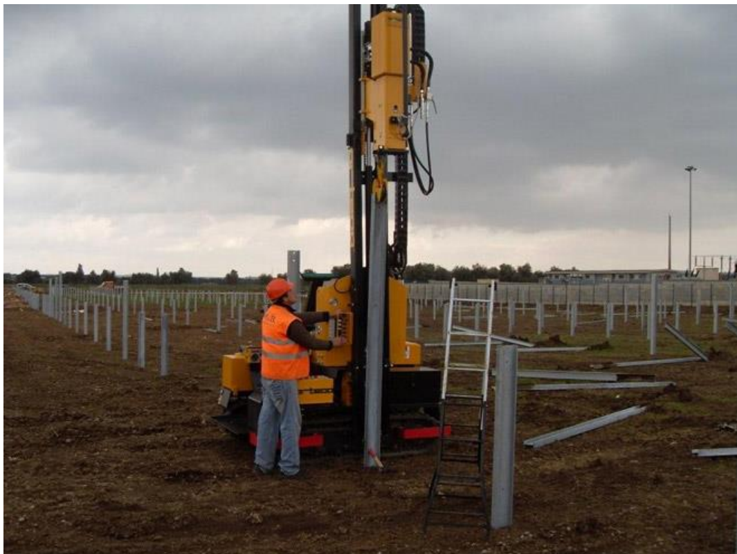
Fig. n°1 Operazione di rimozione dei pali infissi

La rimozione dei pali infissi delle strutture di sostegno, semplicemente sfilati dal terreno sottostante grazie all'ausilio di automezzo munito di braccio gru, avverrà in modo tale da consentire il ripristino geomorfologico dei luoghi con terreno agrario e recuperare il profilo originario del terreno.