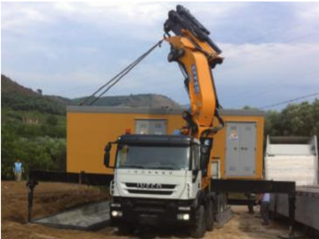
Fig. n°2 Operazione di rimozione delle cabine prefabbricate

Per quanto concerne le cabine elettriche prefabbricate e power skid, si procederà prima allo smontaggio di tutti gli apparati elettronici contenuti nelle cabine elettriche, quali inverter, trasformatori, quadri elettrici, organo di comando e protezione che saranno smaltiti come rifiuti elettrici, e successivamente saranno rimosse le cabine mediante l'ausilio di pale meccaniche e bracci idraulici per il caricamento sui mezzi di trasporto.