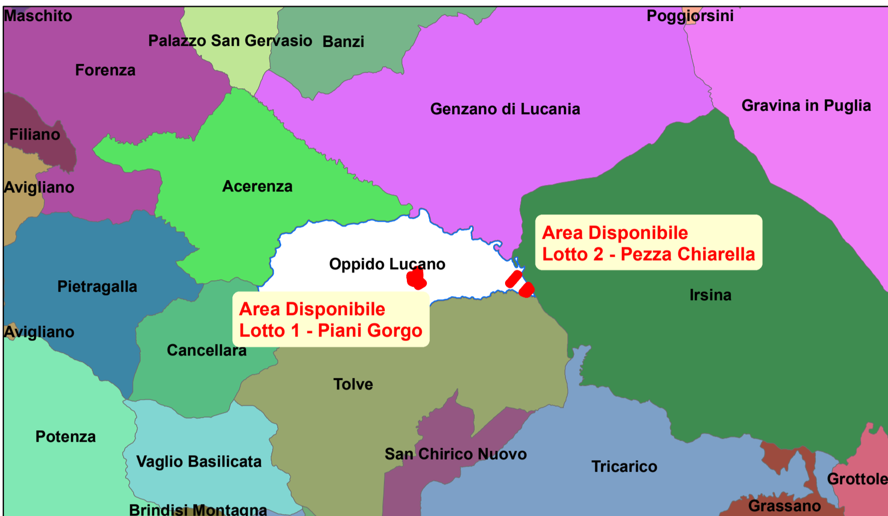
Corografia - Scala 1:200.000