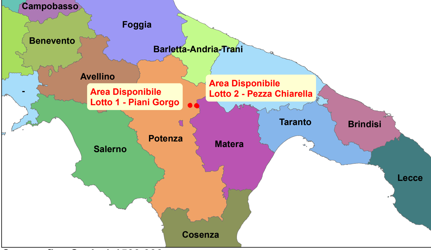
Corografia - Scala 1:1500.000