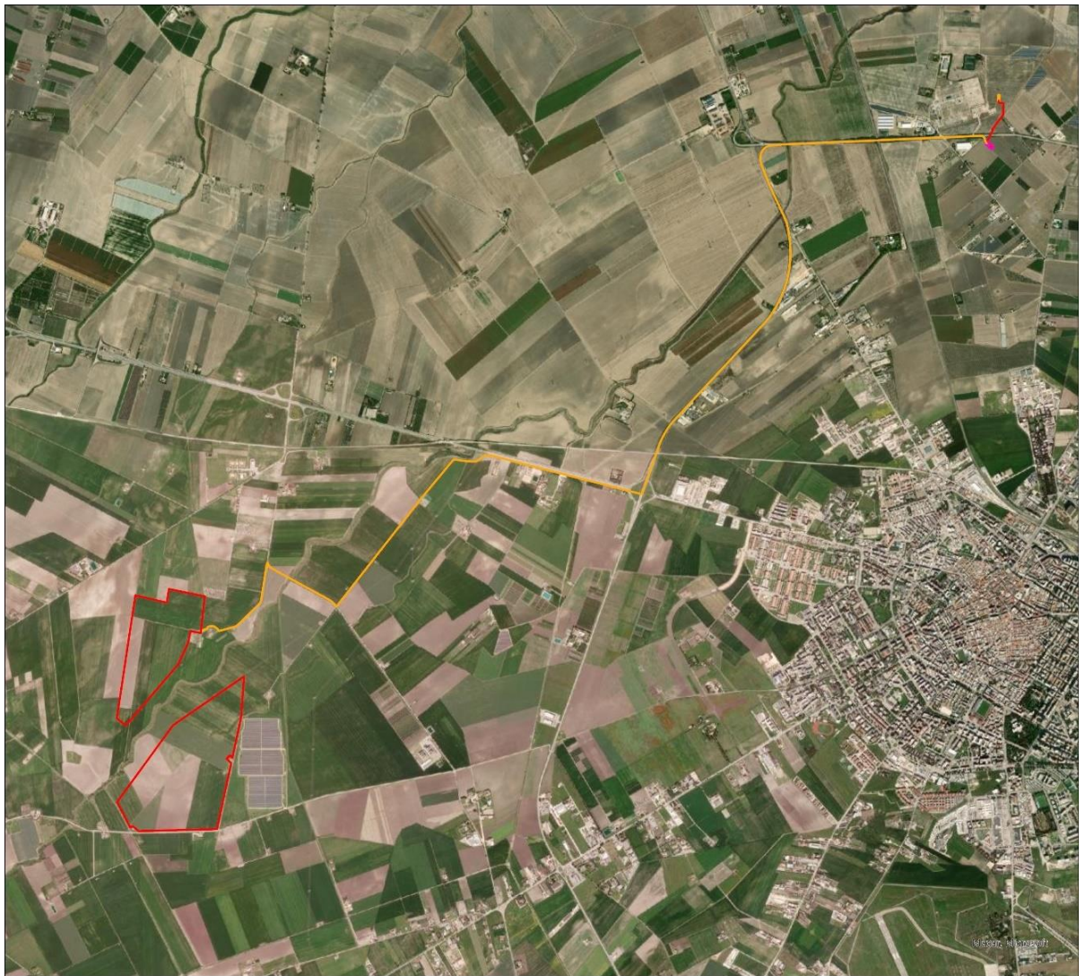
Figura 2.2: Inquadramento territoriale area di progetto.

In riferimento al Catasto Terreni del Comune di Lucera (FG), l'impianto occupa le aree di cui al Foglio 56, 124, 152, sulle particelle indicate nella tabella seguente: