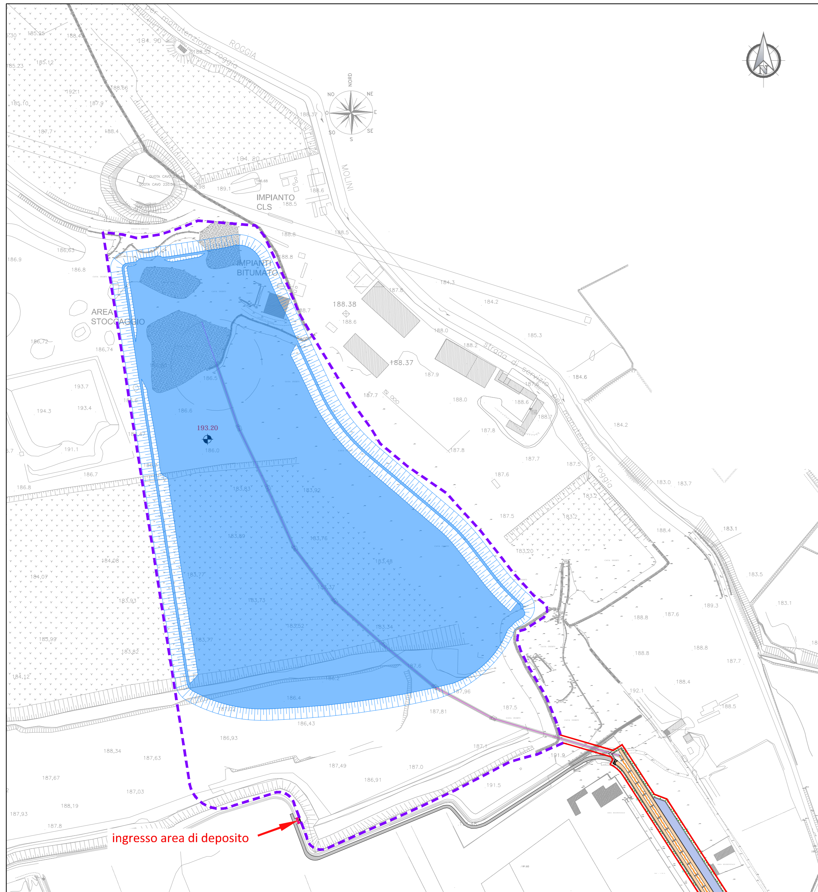
RIEMPIMENTO AREA DI DEPOSITO - FASE 3