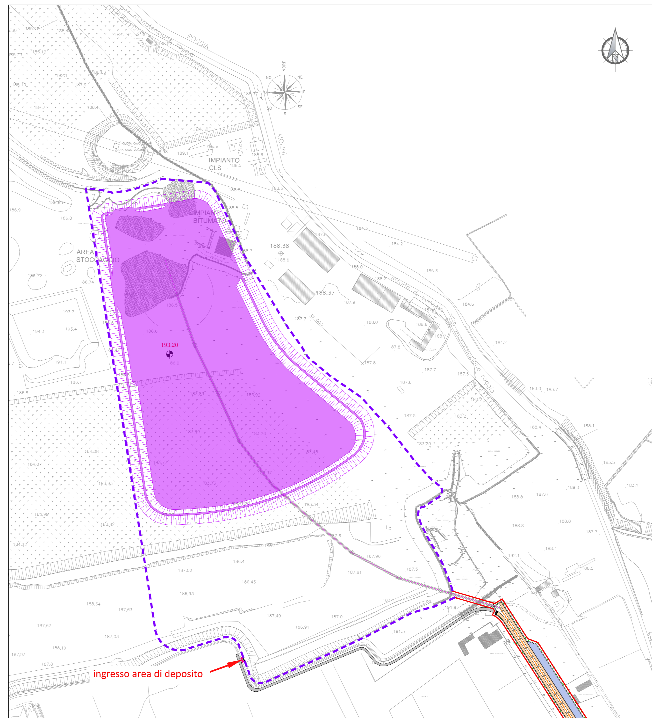
RIEMPIMENTO AREA DI DEPOSITO - FASE 2