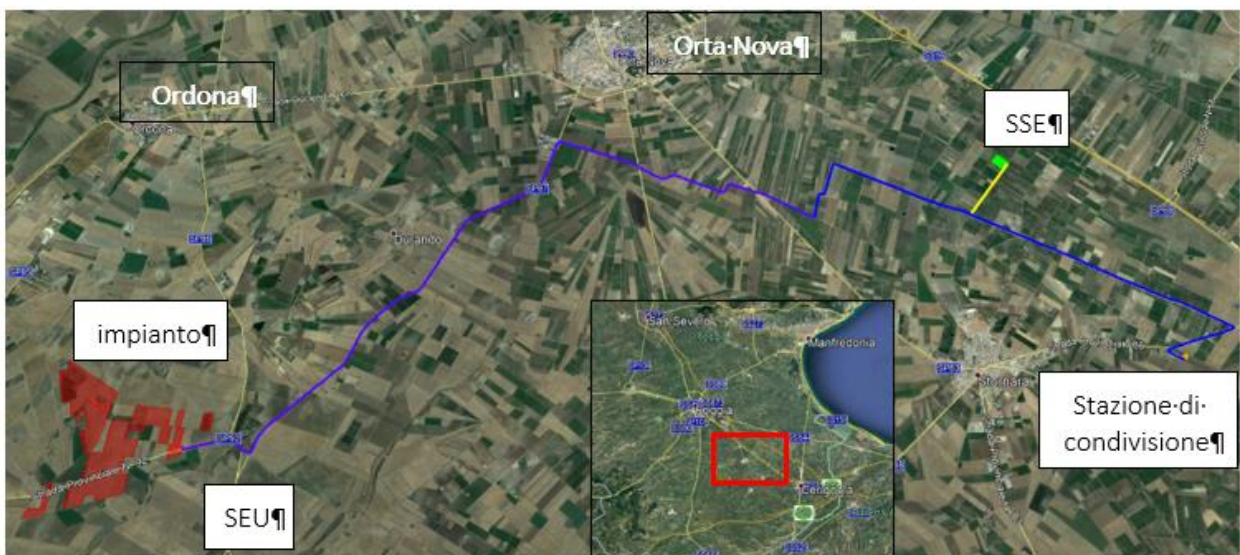
Figura 2.1: Localizzazione dell'Area di Intervento, in rosso l'area recintata, in blu la linea di connessione

La connessione dell'impianto avrà un breve tratto di cavo interrato in MT fino alla cabina di trasformazione, posta nelle immediate vicinanze dell'impianto, per poi proseguire in cavo AT, lungo viabilità pubblica, fino ad una stazione di condivisione ad est dell'abitato di Stornara. Da quest'ultima stazione, sempre con elettrodotto interrato in AT e percorrendo parzialmente a ritroso il sopradescritto cavidotto, si arriverà al punto di allaccio finale nella sottostazione di trasformazione della RTN 150 kV ubicata a circa 2 km a NNE di Stornara. Complessivamente la connessione avrà una lunghezza di circa 19,25 km fino alla Stazione di condivisione e di circa 6 km per il tratto dalla stazione di condivisione alla SSE.