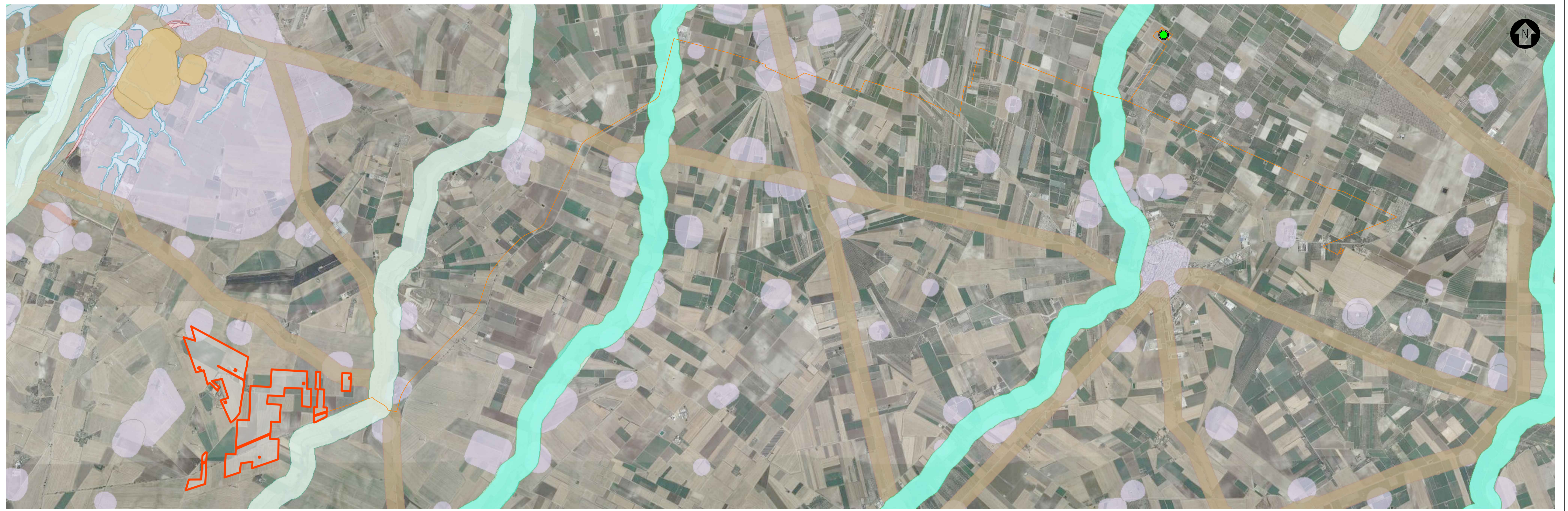
STRALCIO CARTOGRAFICO SISTEMA INFORMATIVO TERRITORIALE - REGIONE PUGLIA - IMPIANTI FER DGR2122