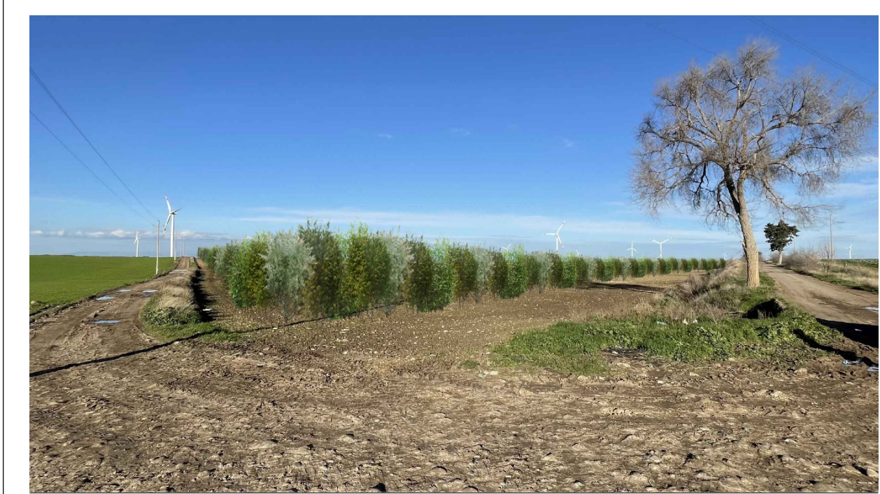
FOTOINSERIMENTO 2 - STATO DI PROGETTO