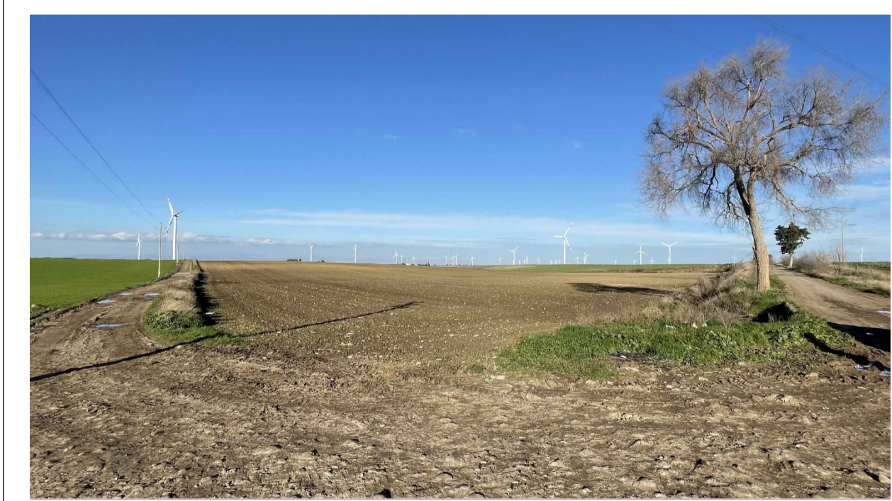
FOTOINSERIMENTO 2 - STATO DI FATTO