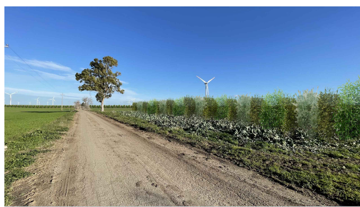
FOTOINSERIMENTO 1 - STATO DI PROGETTO