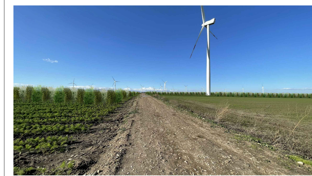
FOTOINSERIMENTO 2 - STATO DI PROGETTO