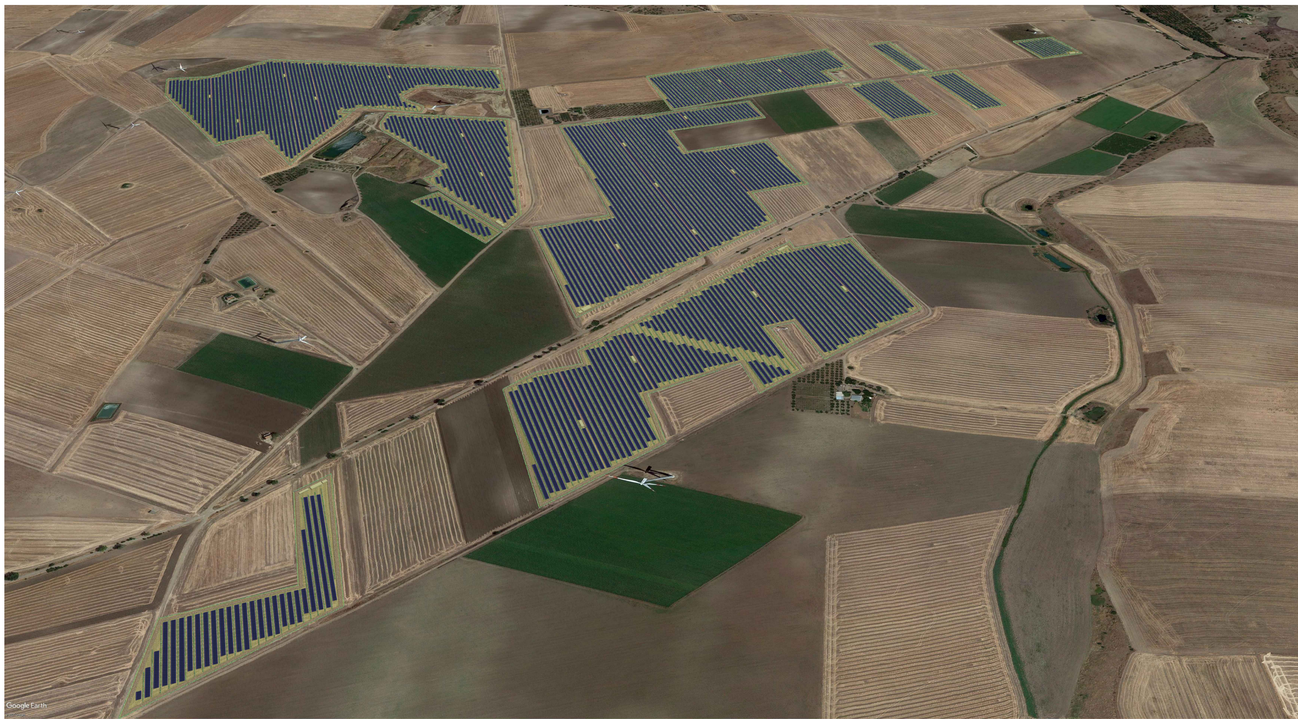
VISTA AEREA IMPIANTO