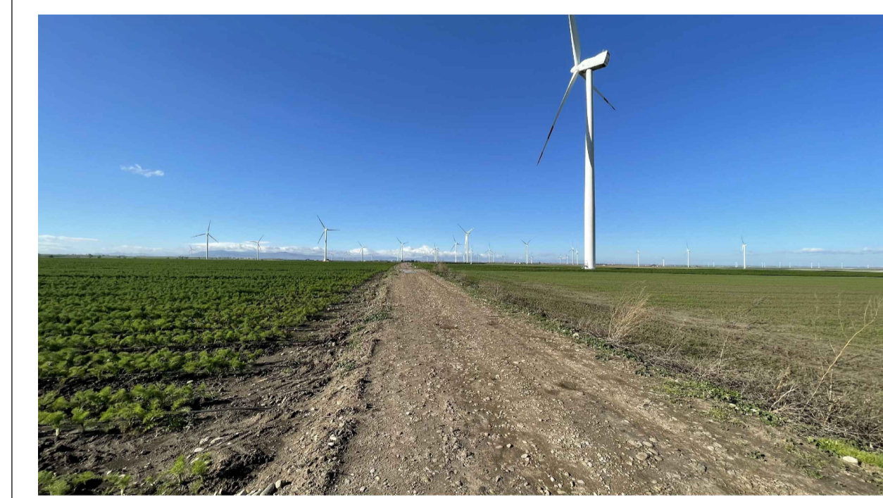
FOTOINSERIMENTO 2 - STATO DI FATTO