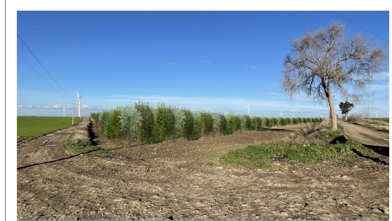
FOTOINSERIMENTO 2 - STATO DI PROGETTO