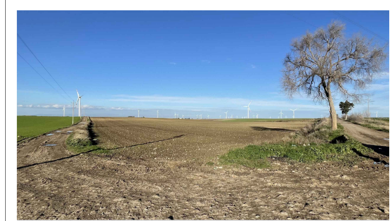
FOTOINSERIMENTO 2 - STATO DI FATTO