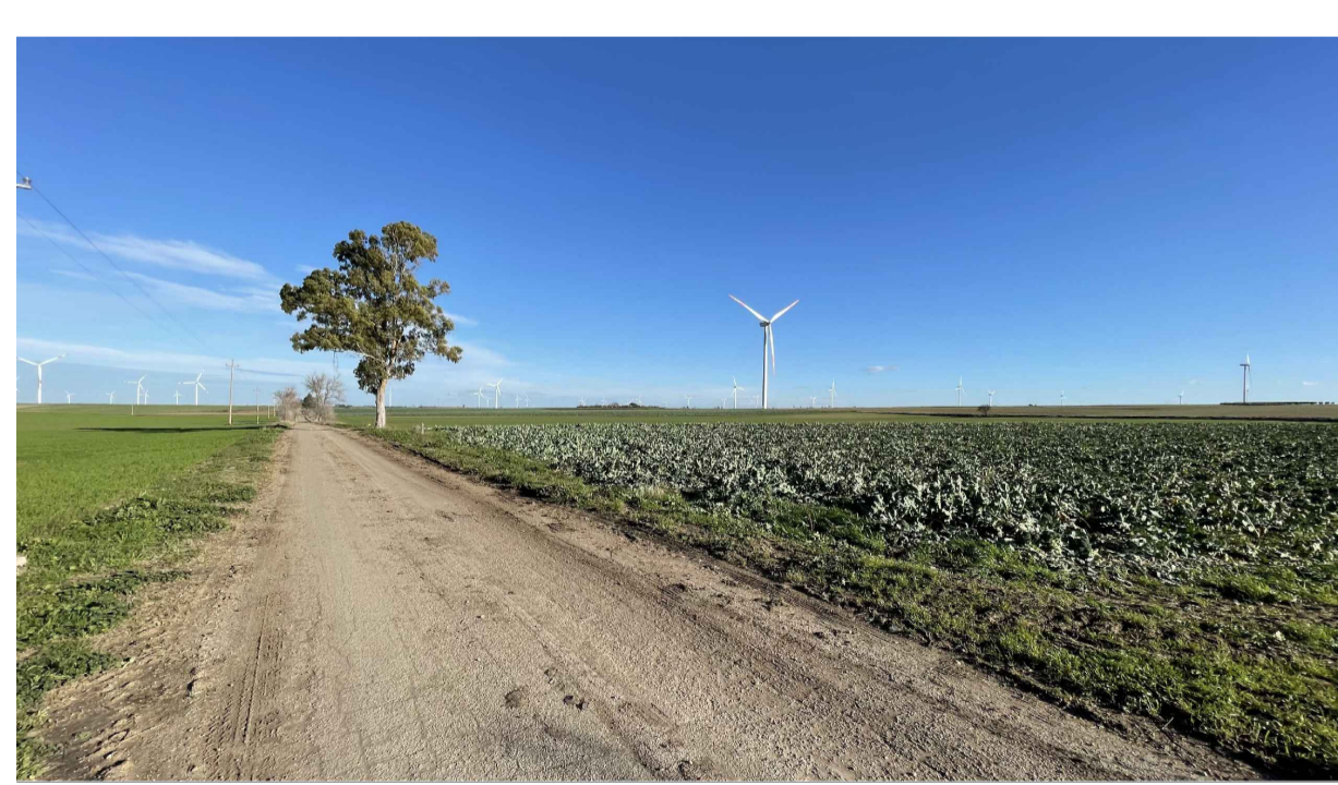
FOTOINSERIMENTO 1 - STATO DI FATTO