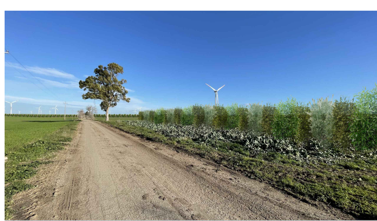
FOTOINSERIMENTO 1 - STATO DI PROGETTO