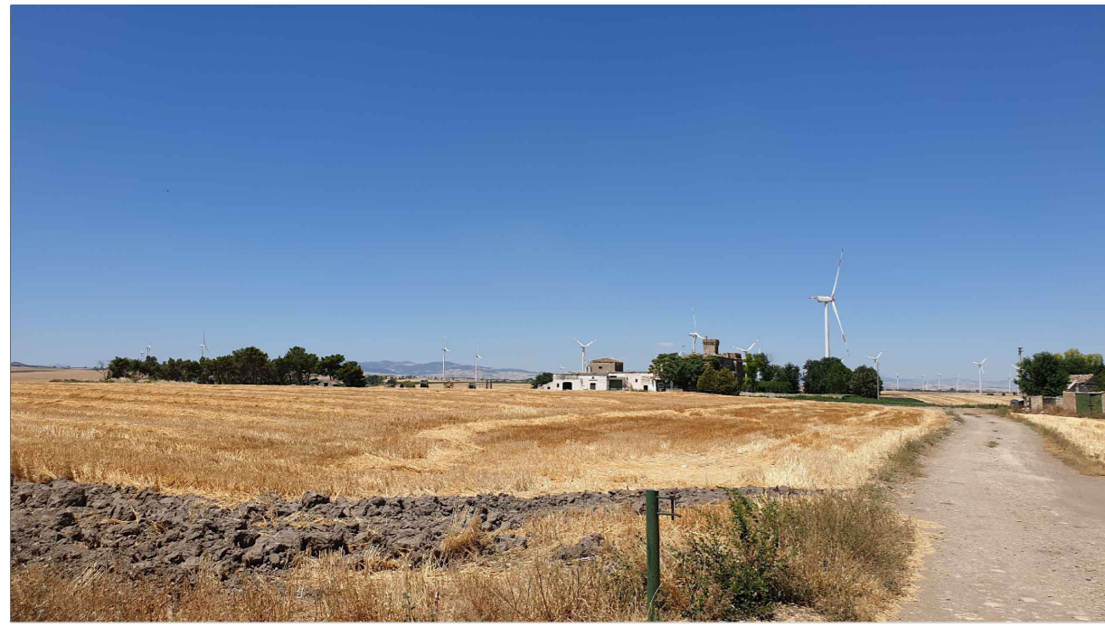
FOTOINSERIMENTO 10 - STATO DI FATTO