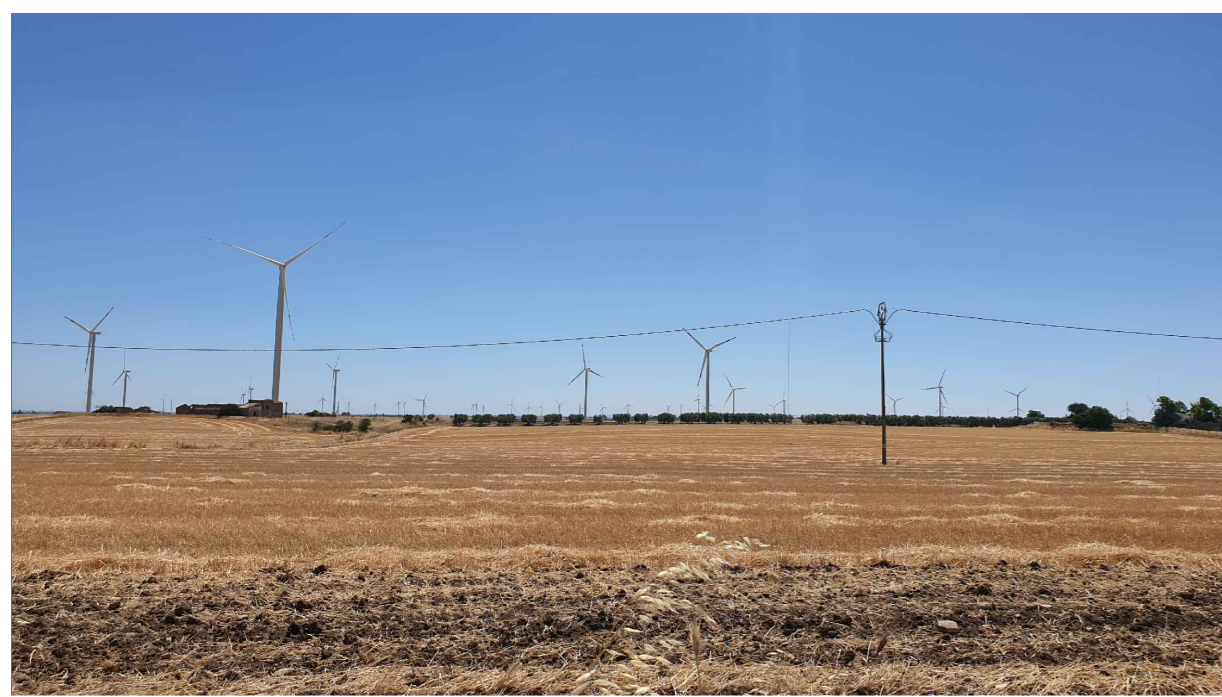
FOTOINSERIMENTO 13 - STATO DI FATTO