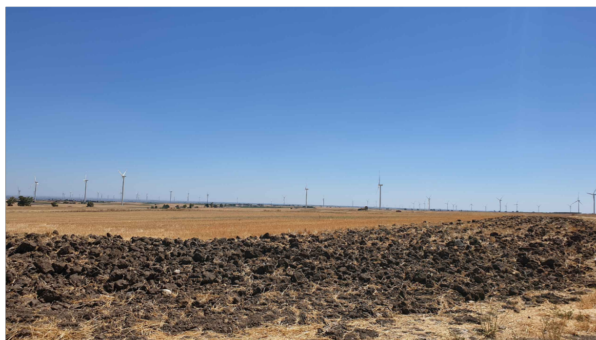
FOTOINSERIMENTO 12 - STATO DI PROGETTO