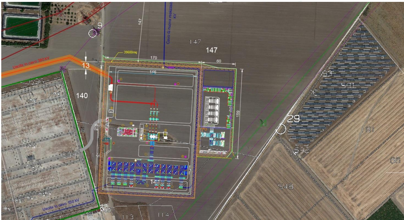
Area S.S.E.U. - Inquadramento Catastale

L'area individuata è identificata al N.C.T. di Foggia nel foglio di mappa 37 particelle 147 come rappresentato nella tavola allegata.