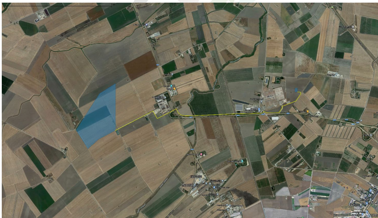
Figura 3-1: Localizzazione area di intervento, in blu la perimetrazione del sito, in giallo il tracciato della connessione

L'impianto fotovoltaico in progetto, del tipo "Utility Scale" e sito nel Comune di Foggia (FG), della potenza di 35 MWn si connette alla Rete Elettrica Nazionale mediante la Stazione Elettrica a 380/150 kV di Foggia attraverso un elettrodotto in cavo interrato della lunghezza di circa 3,97 Km.