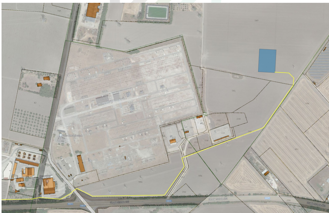
Figura 3-3: Inquadramento Catastale SSEU, in blu le aree contrattualizzate