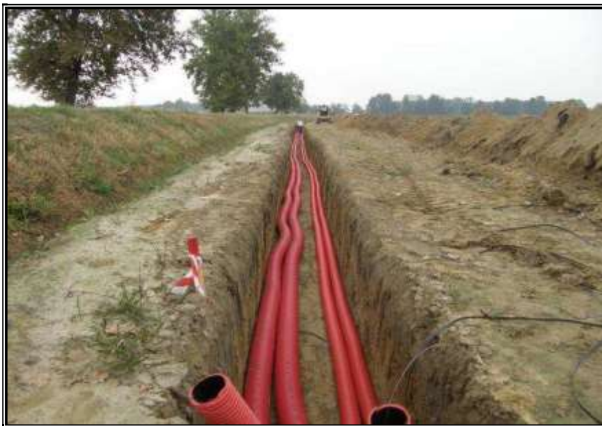
figura n. 7 – Alcune fasi relative per la costruzione dell'impianto