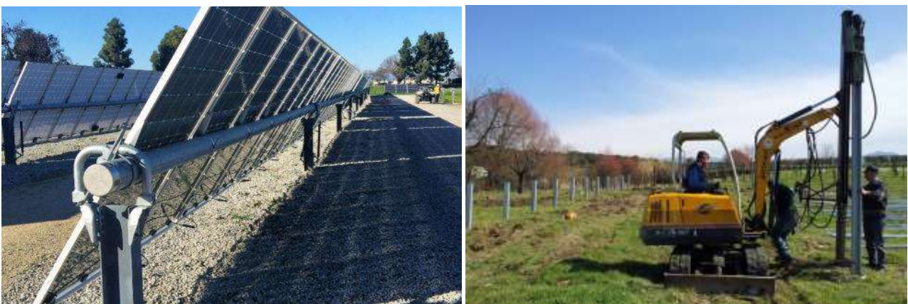
Figura 1 – Esempio di posa delle strutture portanti

I pannelli fotovoltaici saranno posizionati su uno scheletro di acciaio avente la base direttamente inserita nel terreno; non vi sarà quindi una piattaforma di cemento. Per la posa del basamento in acciaio si prevede l'utilizzo di un battipalo come indicato in Figura 3.