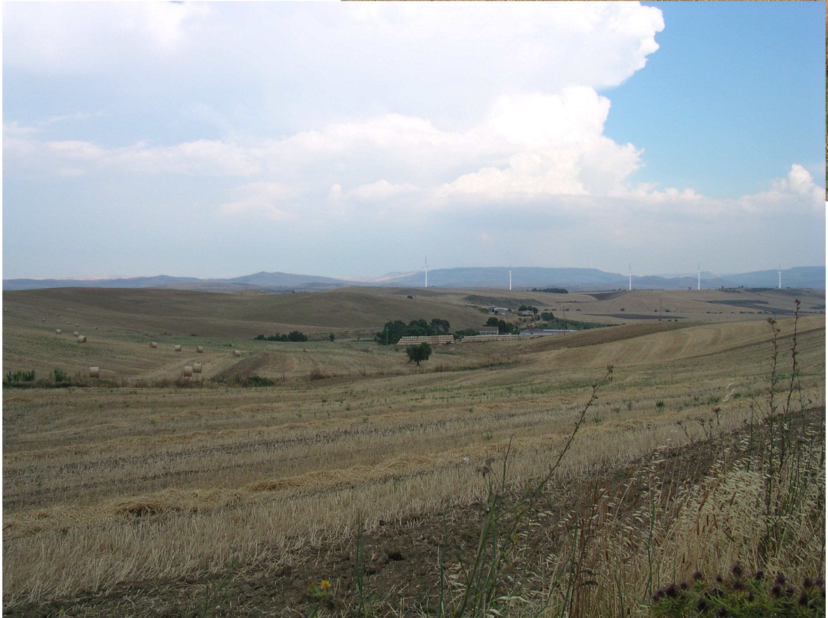
Vista Strada provinciale per Potenza