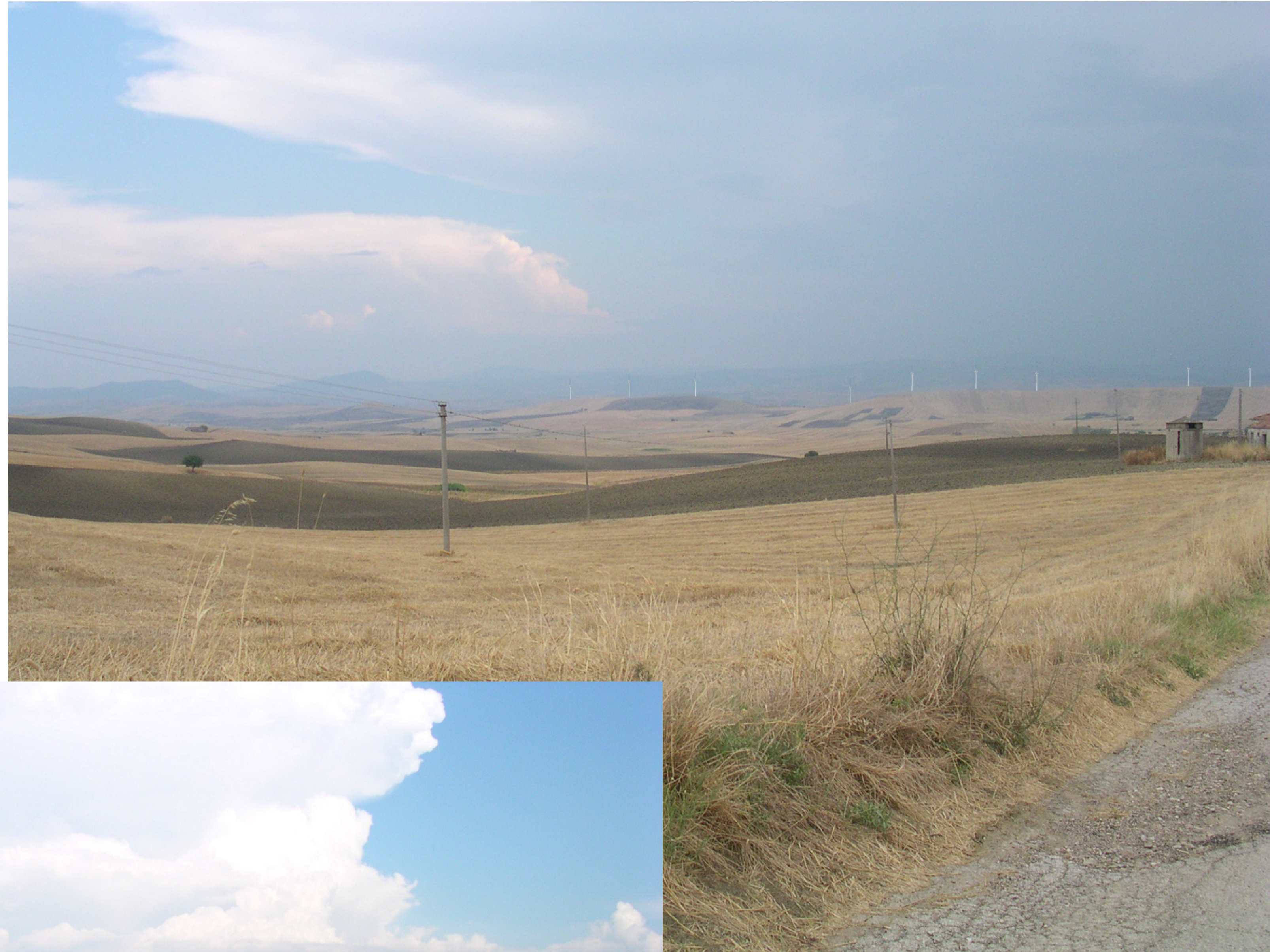
Vista monte Serico