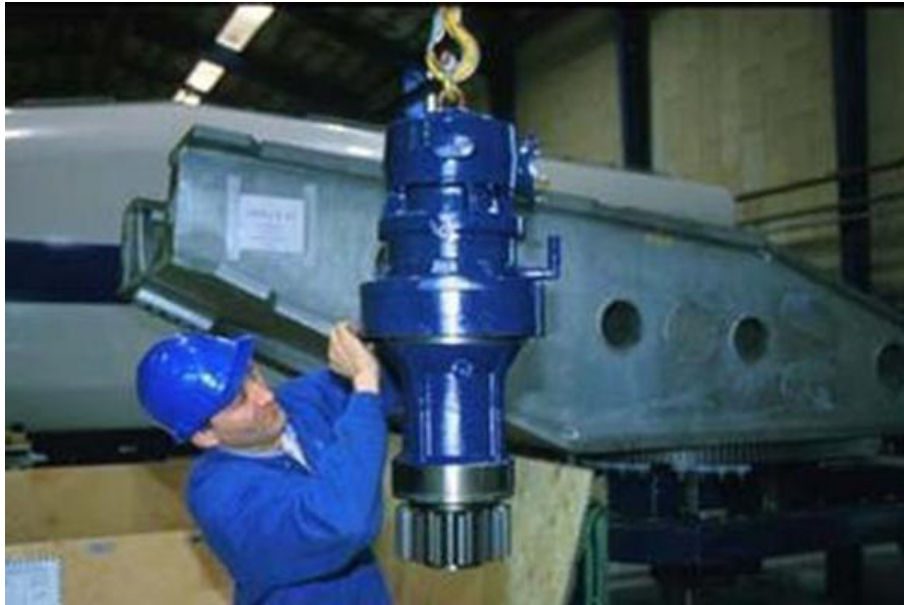
Figura 8: Motori di giro e riduttori

Progetto dell'impianto eolico con storage denominato "Sava Maruggio" della potenza complessiva di 182 MW da realizzare nei Comuni di Sava (TA), Manduria (TA), Maruggio (TA), Torricella (TA) ed Erchie (BR).