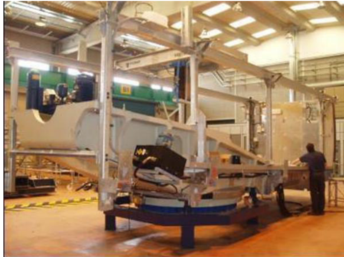
Figura 11: Telaio anteriore e posteriore