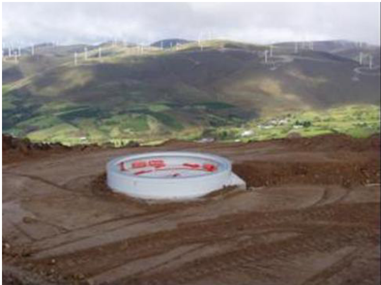
Figura 14: Fondazione

La base in calcestruzzo si può eliminare tramite il deposito in discarica dei rifiuti inerti o può essere riciclata come agglomerato per usi nelle costruzioni civili. In quest'ultimo caso, è meglio quando il volume generato dal rifiuto è elevato.