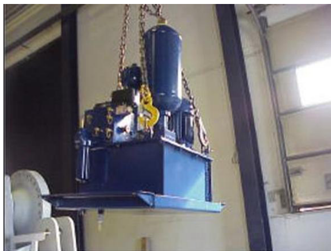
Figura 9: Gruppo di pressione