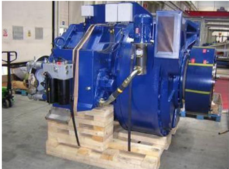
Figura 5: Moltiplicatore