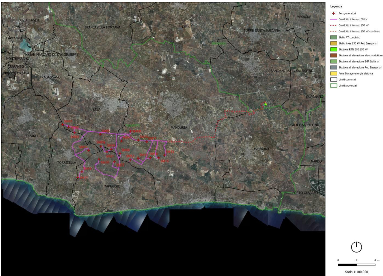
Figura 2 | Inquadramento su base Ortofoto Regione Puglia

Progetto dell'impianto eolico con storage denominato "Sava Maruggio" della potenza complessiva di 182 MW da realizzare nei Comuni di Sava (TA), Manduria (TA), Maruggio (TA), Torricella (TA) ed Erchie (BR).