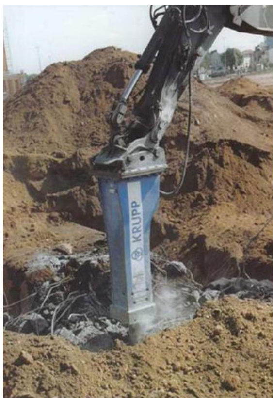
Figura 15 Trivellazione

Il primo passo è l'abbattimento della mole di calcestruzzo e ferro utilizzando martelli idraulici, così da ottenere la frammentazione del materiale.