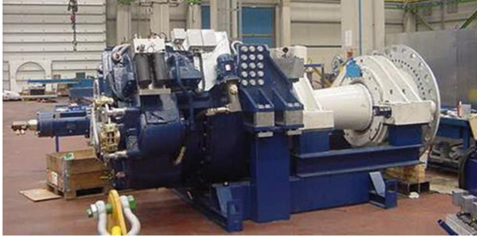
Figura 6: Asse di alta velocità

Nel caso in cui qualche pezzo di questi componenti si trovi in buono stato si può pensare al loro riutilizzo in componenti simili.