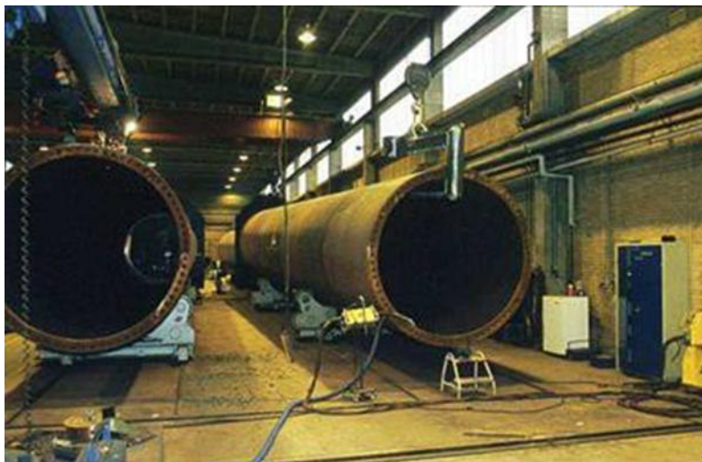
Figura 13: Torri

Nel caso in cui questi componenti vengano smantellati, il loro riutilizzo nell'ambito nel settore eolico si presenta poco fattibile, a causa delle esigenze di resistenza strutturale che richiede l'installazione degli aerogeneratori. Allo stesso modo, i nuovi aerogeneratori installati richiedono strutture più grandi e resistenti, per cui non è fattibile lo sfruttamento di strutture obsolete.