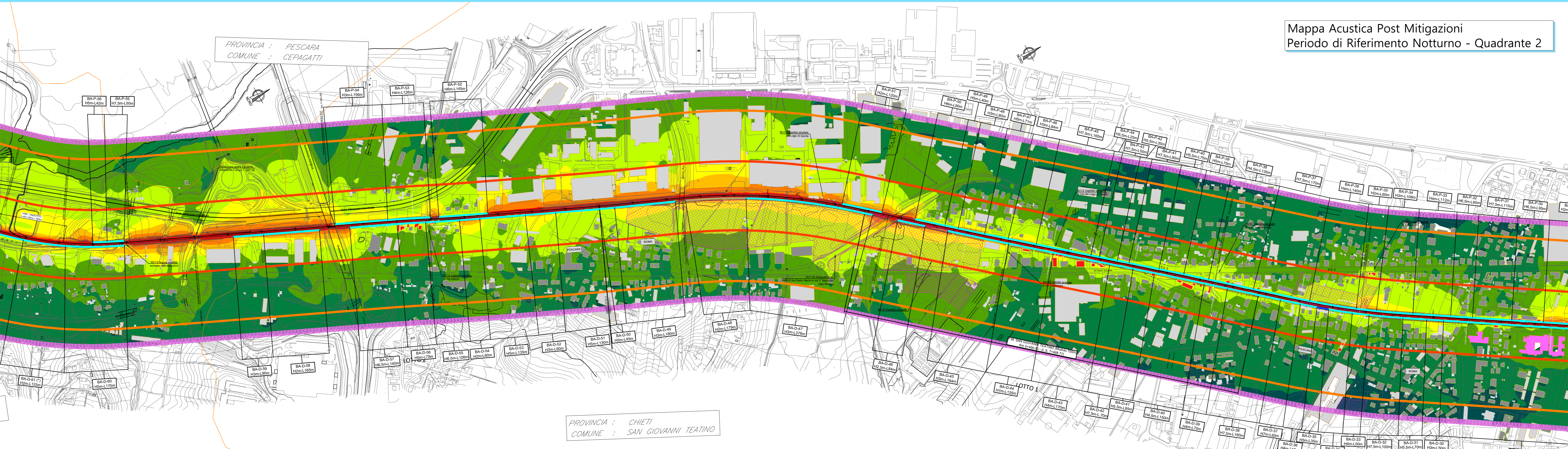
Mappa Acustica Post Mitigazioni Periodo di Riferimento Notturno - Quadrante 2