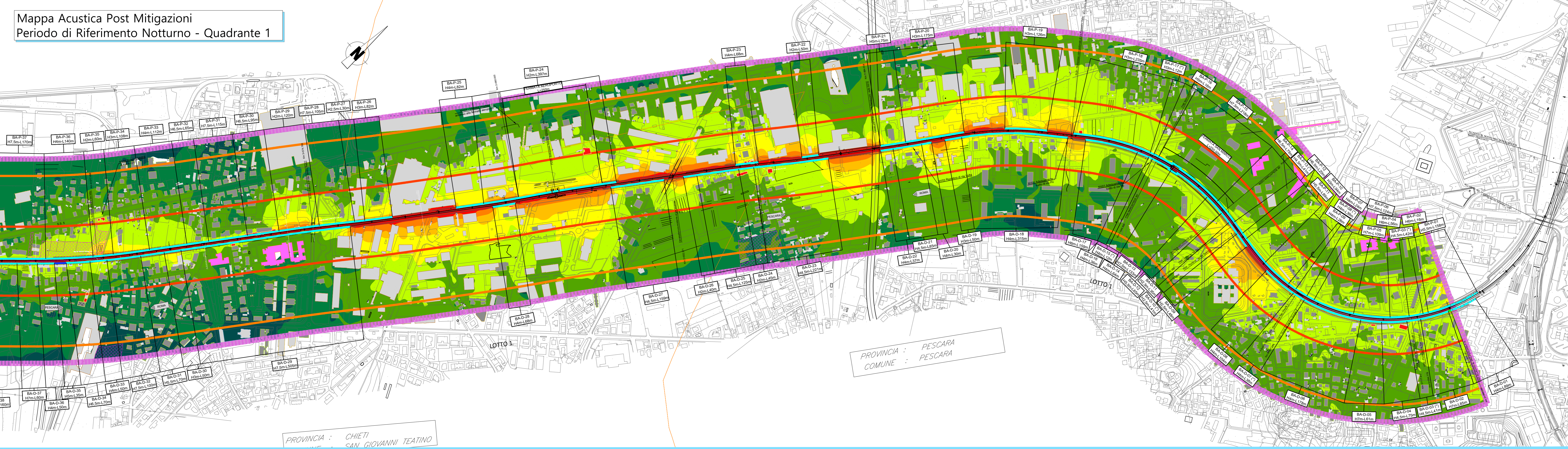
Mappa Acustica Post Mitigazioni Periodo di Riferimento Notturno - Quadrante 1