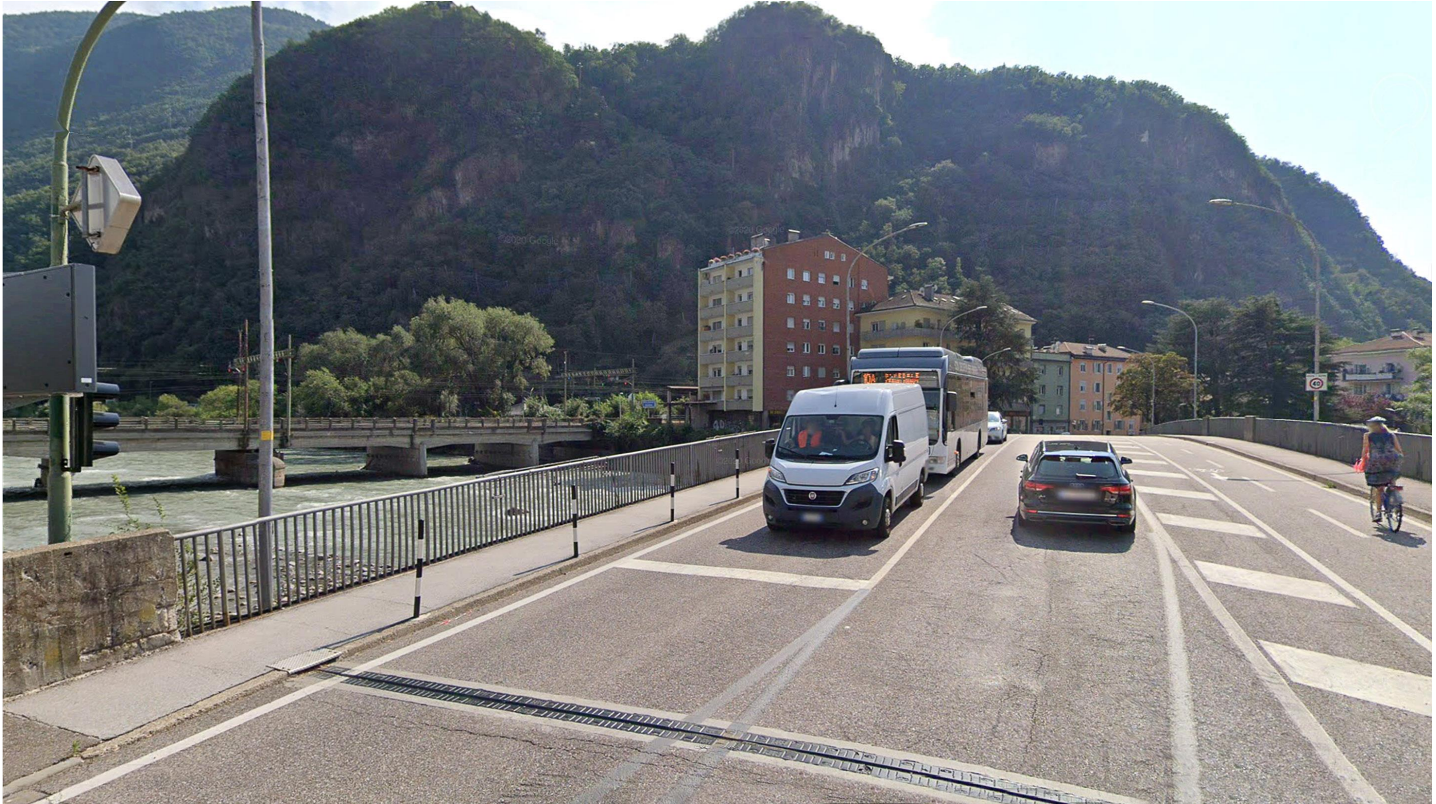
F02 ANTE OPERAM