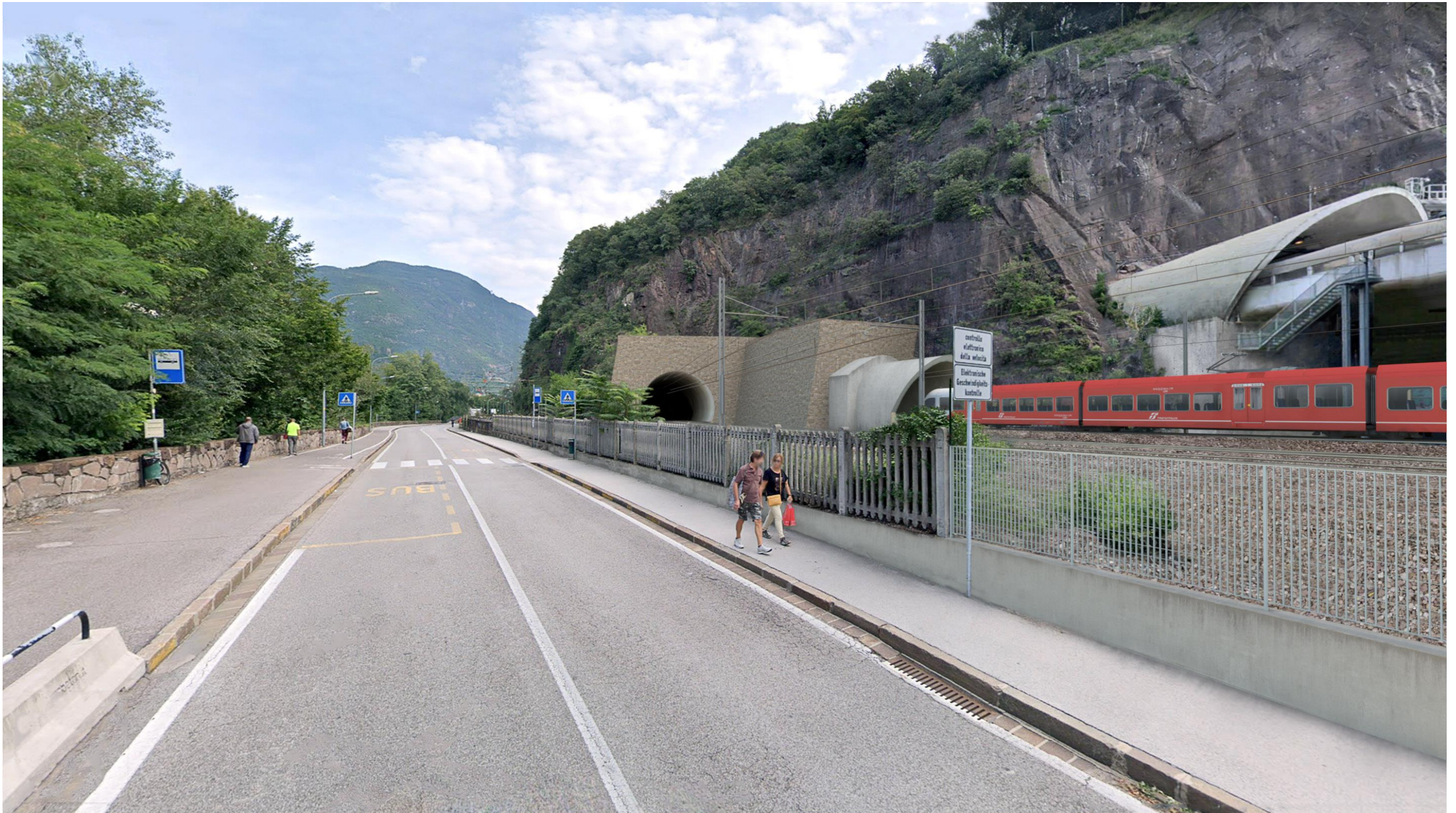
F01 -POST OPERAM