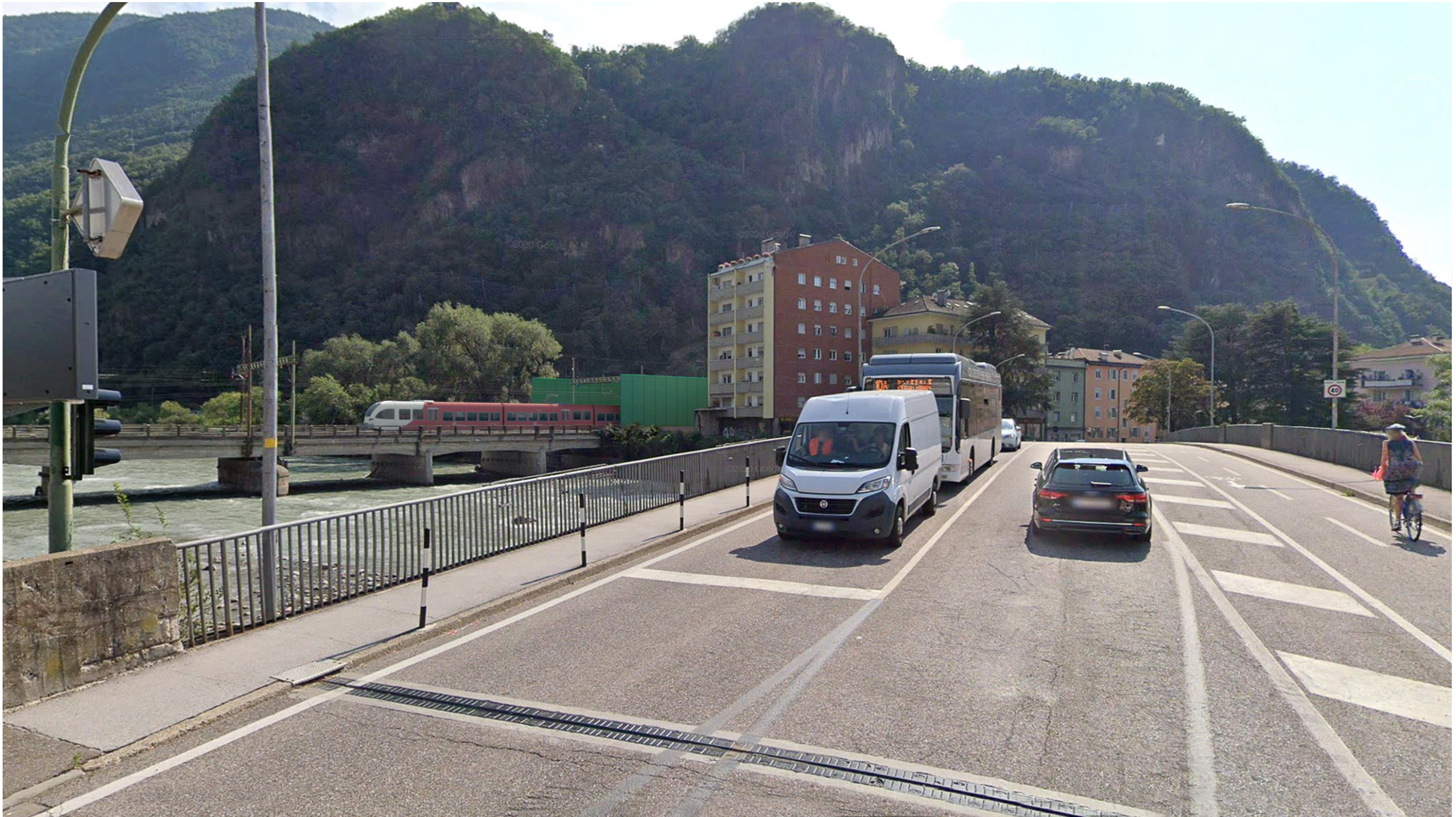
F02 POST OPERAM