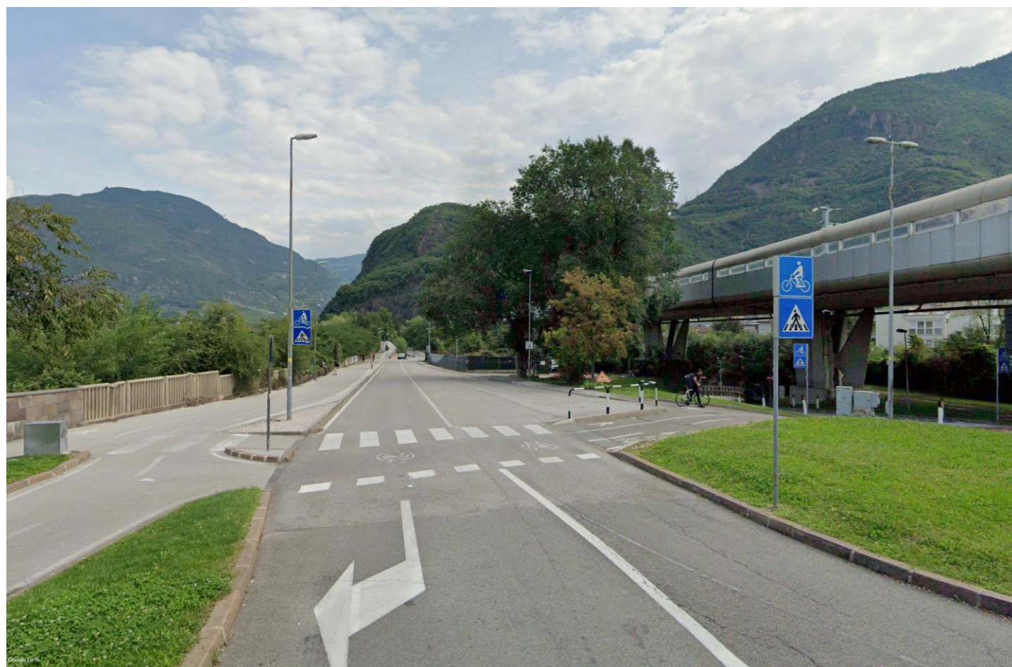
Figura 1-5 PV05