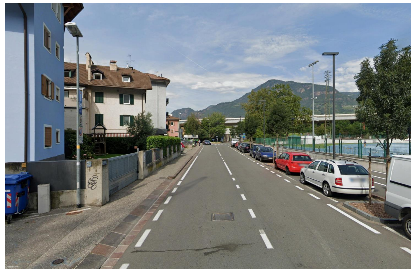
Figura 1-4 PV04