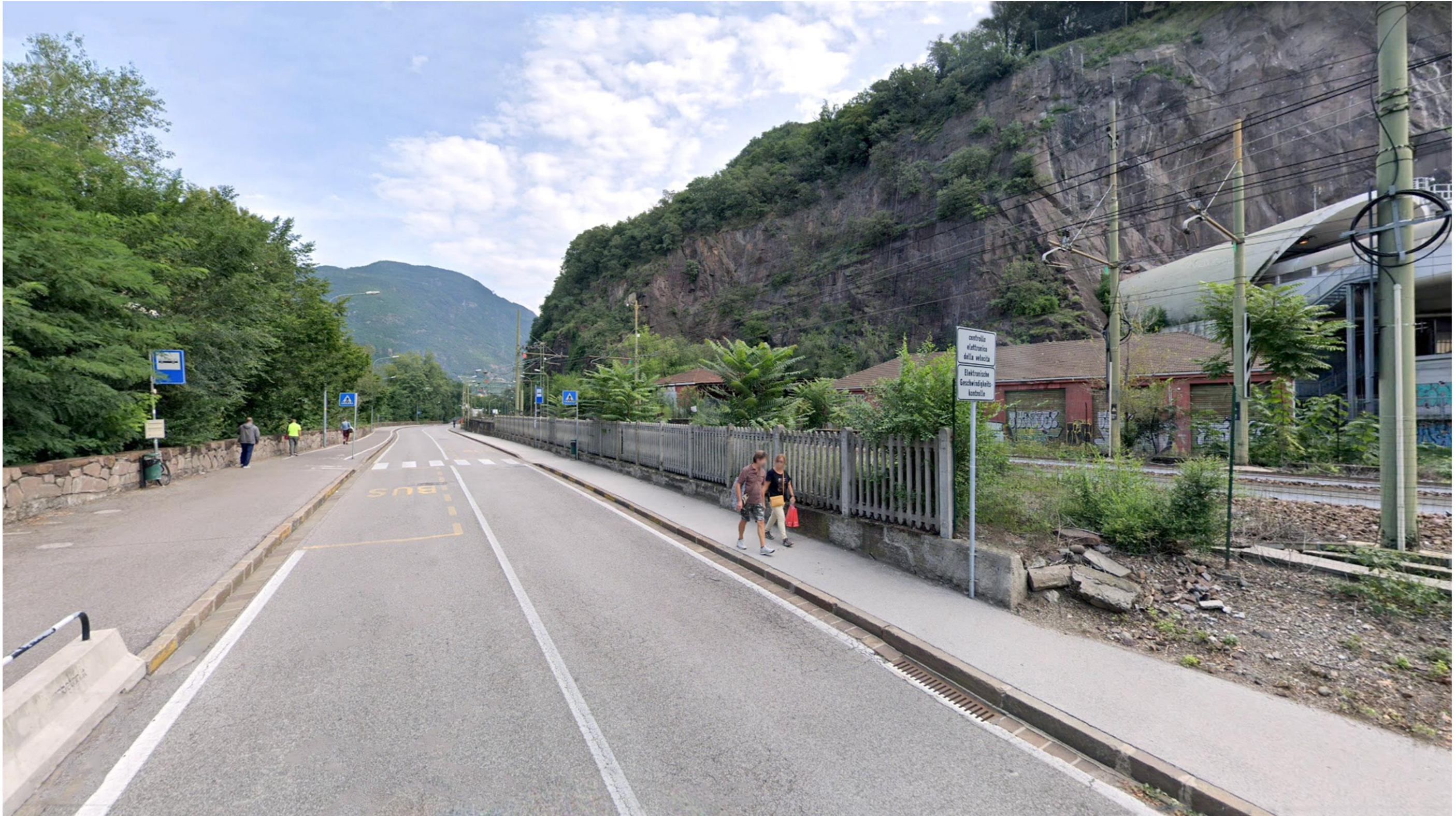
F01 – ANTE OPERAM