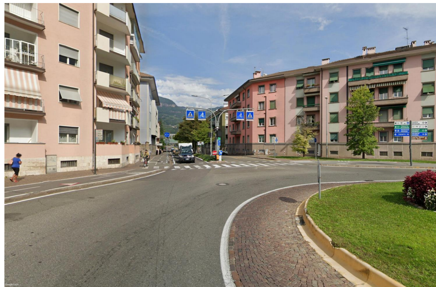
Figura 1-2 PV02