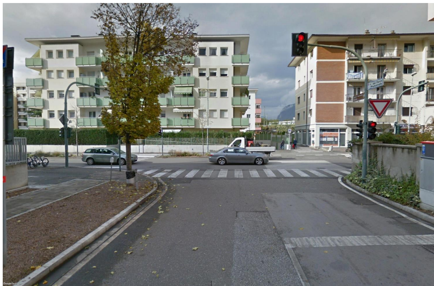
Figura 1-3 PV03