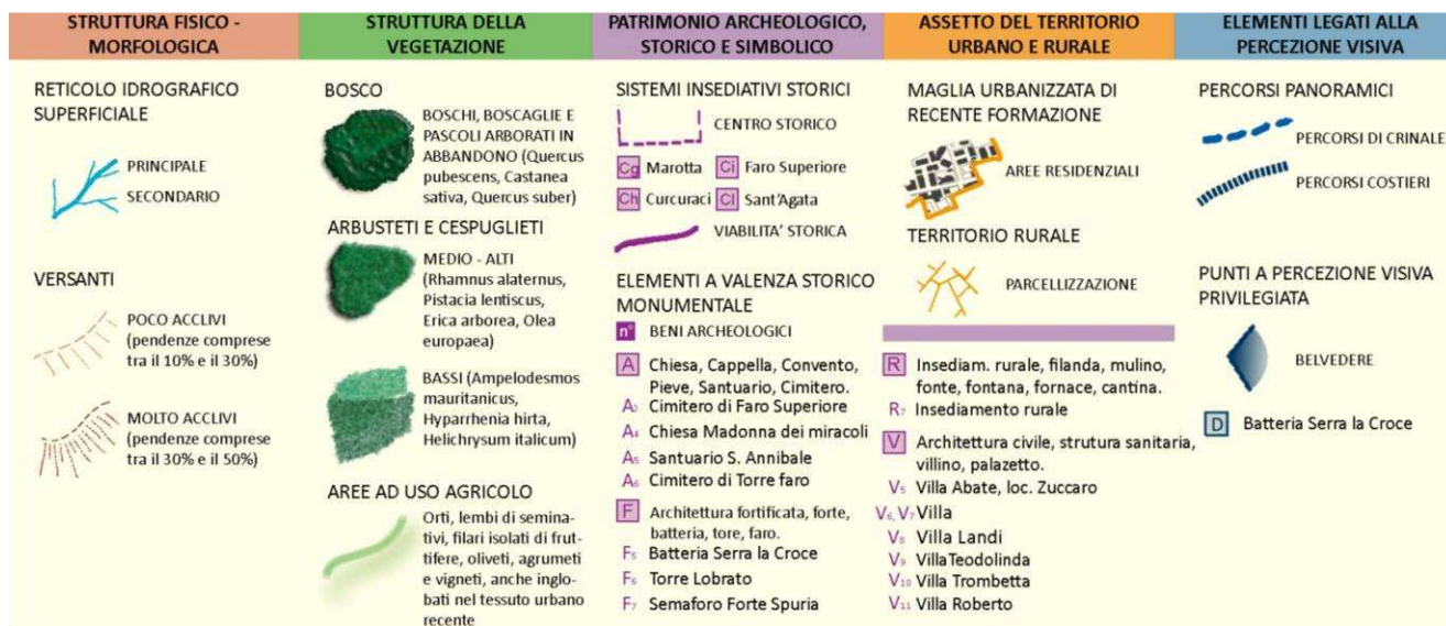
Fig. 1 – Gli apparati rappresentati nella Carta delle Unità di paesaggio

Per fornire un'idea del tipo di caratterizzazione effettuata per le singole unità di paesaggio base si riporta uno stralcio della descrizione effettuata per la CAL1 (a sua volta parte dell'Unità regionale Costa Viola).