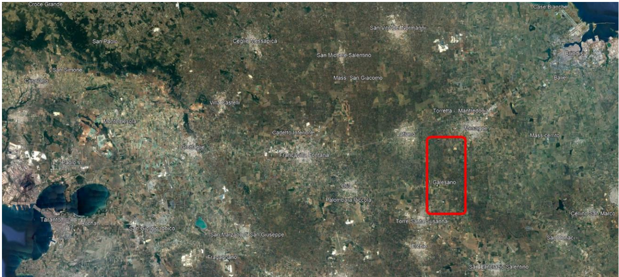
Figura 1: Individuazione su Ortofoto

Il sito oggetto del presente elaborato è ubicato a circa 20 km a sud-ovest di Brindisi, nei territori Comunali di Torre Santa Susanna, Mesagne e Latiano, in Provincia di Brindisi, Regione Puglia. L'area interessata si sviluppa in un'area pianeggiante, a circa 22 km dalla costa Adriatica. Di seguito è riportato l'inquadramento territoriale dell'area di progetto e la configurazione proposta su ortofoto.