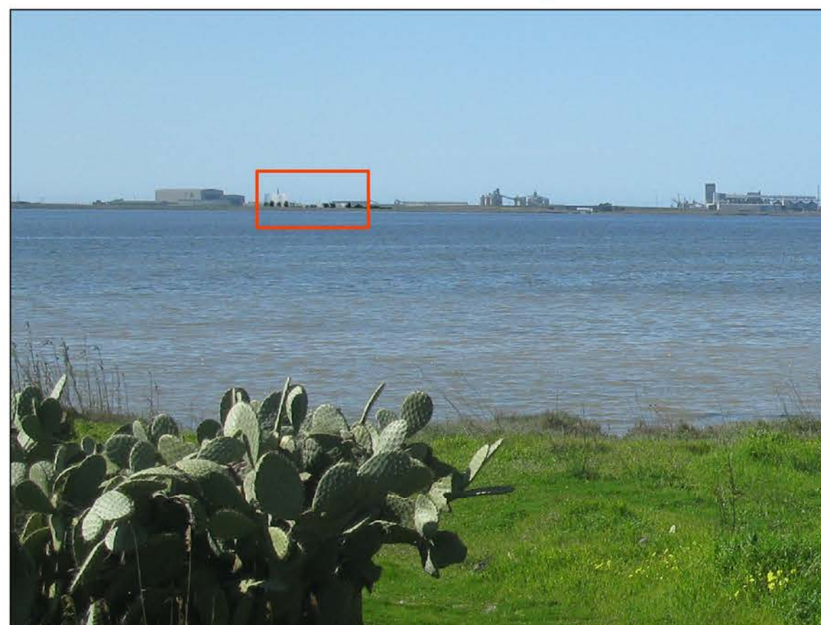
SITUAZIONE FUTURA, DETTAGLIO