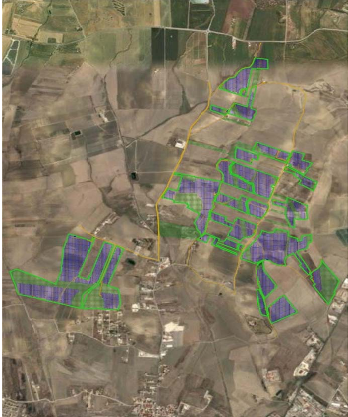
Figura 1.2: Inquadramento su Ortofoto