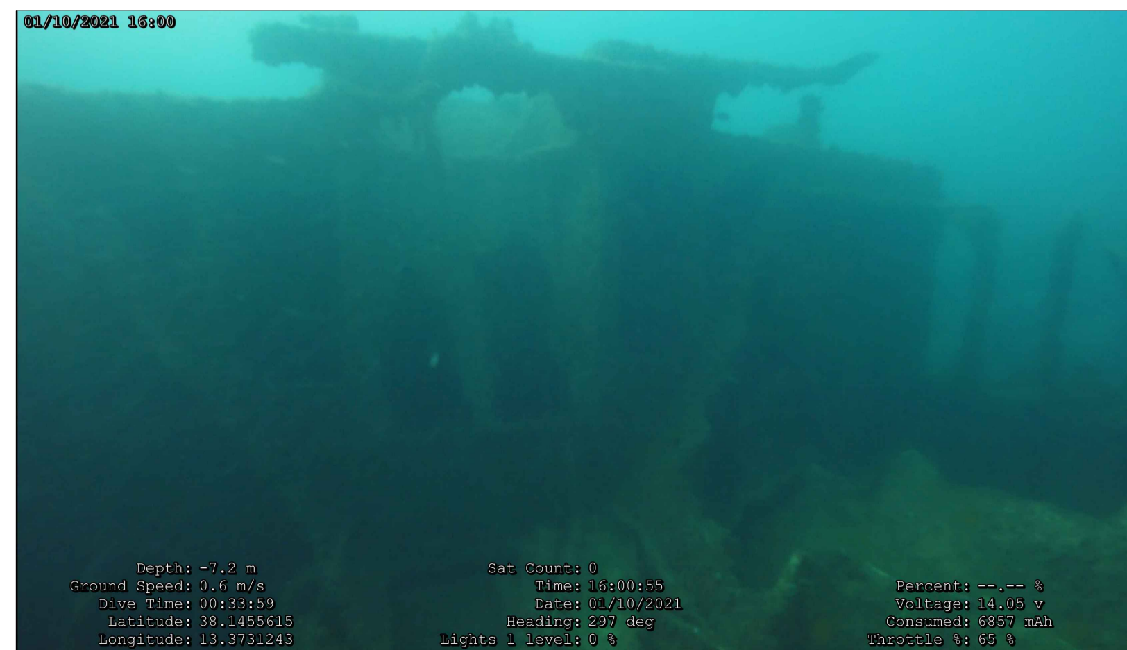
Foto 8- Moncone del relitto