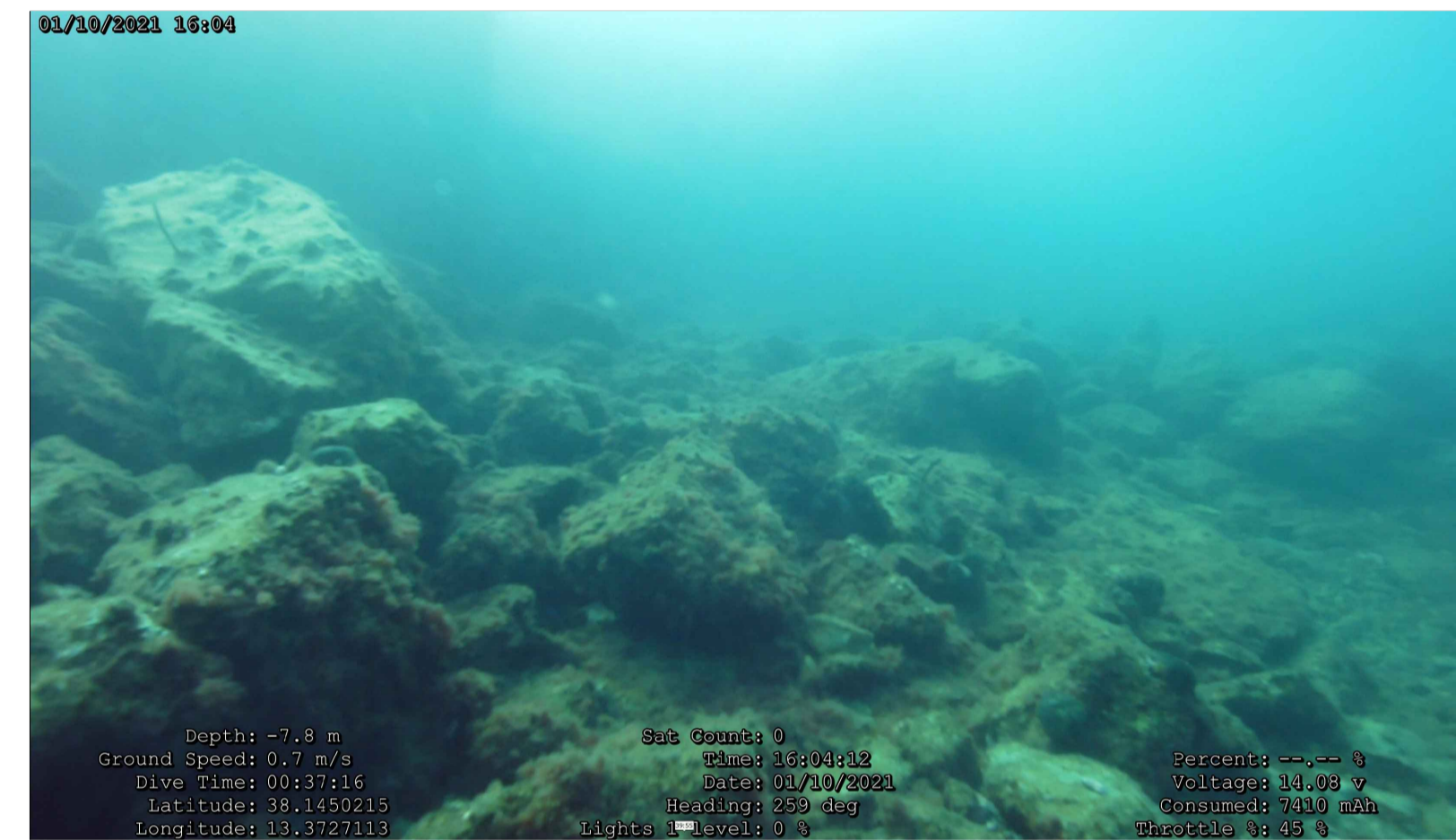
Foto 6- Fondale al piede della massicciata lato foraneo