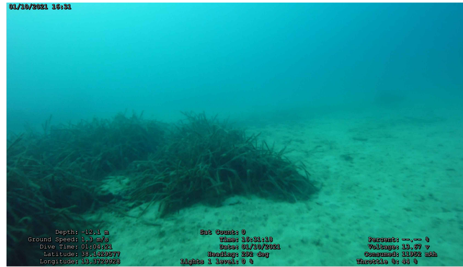
Foto 2- Fondale sabbioso con macchie di Posidonia