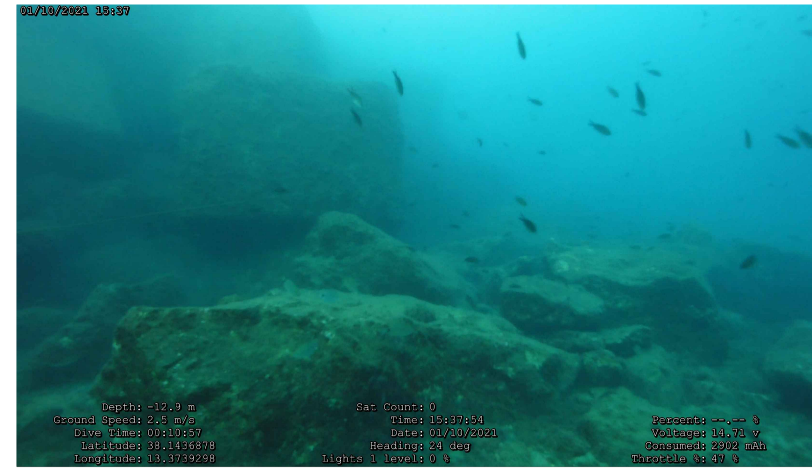
Foto 3- Fondale al piede della massicciata lato porto