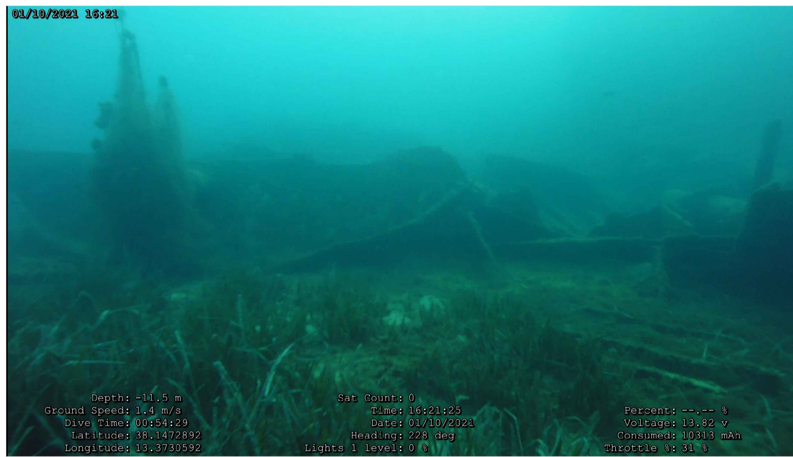
Foto 4- Lamiere del relitto e rete incagliata