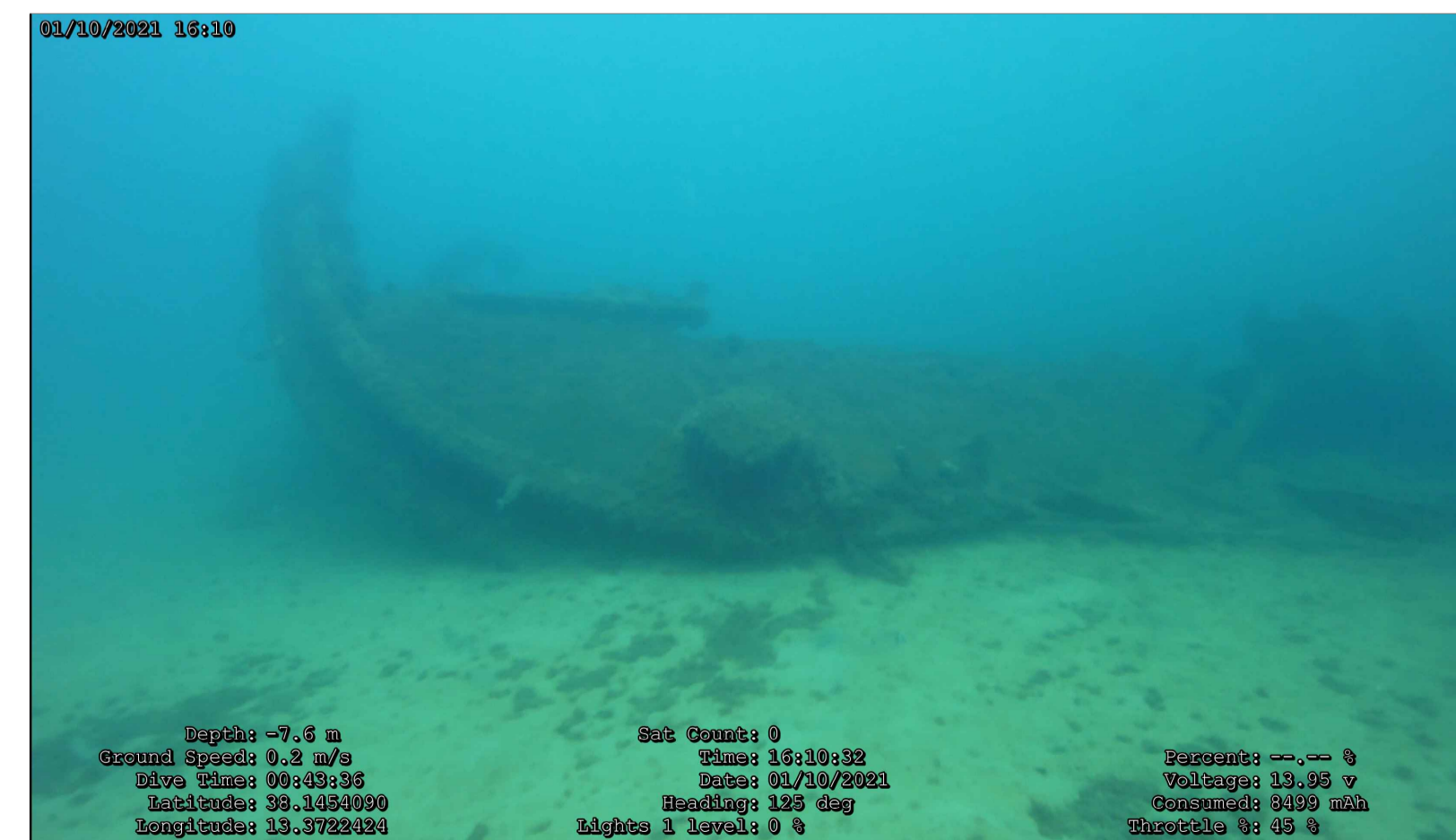
Foto 9- Moncone della fiancata del relitto