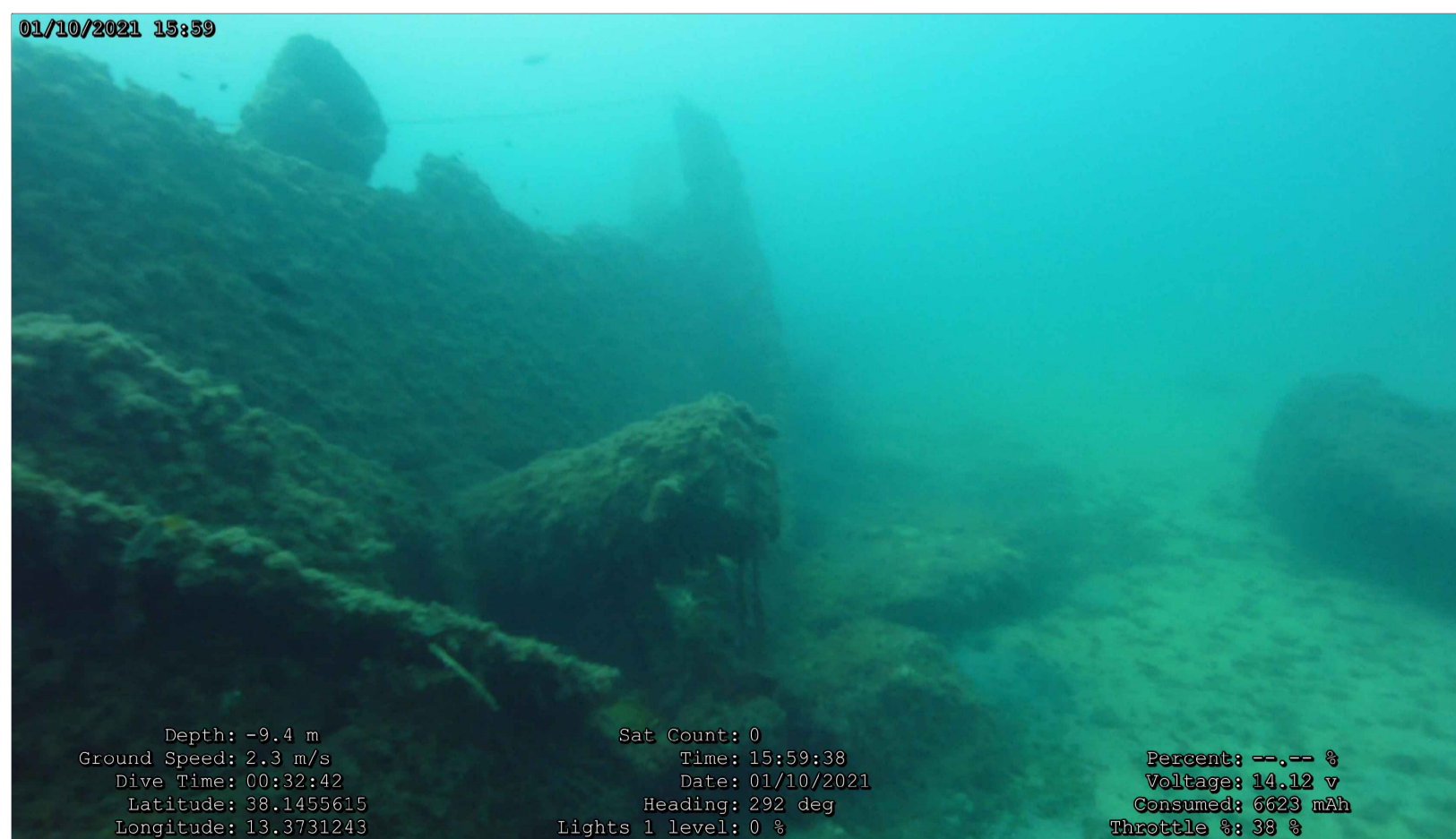
Foto 7- Moncone del relitto e fondale sabbioso