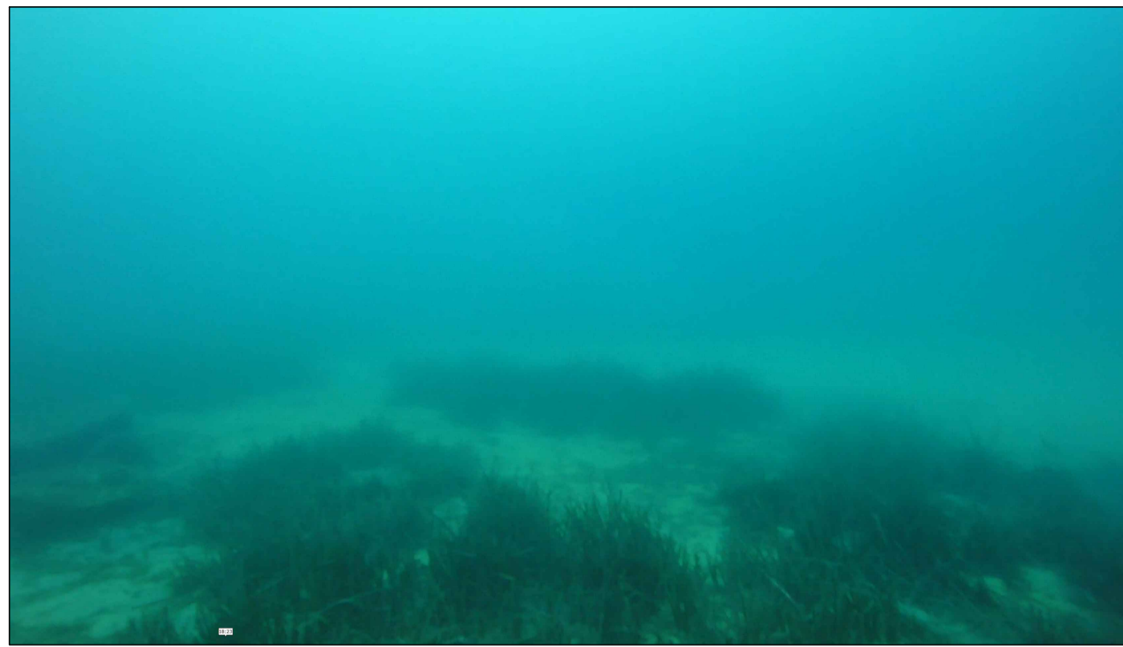
Foto 1- Fondale sabbioso con macchie di Posidonia