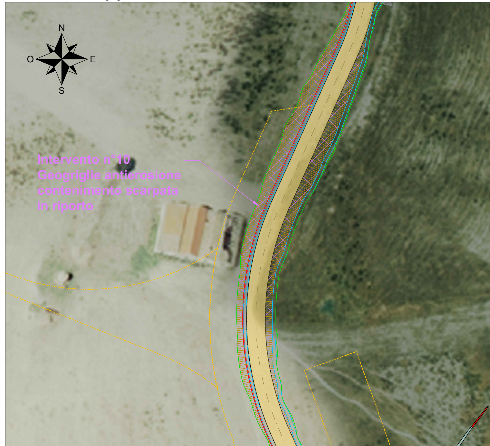
Intervento n°10 - Geogriglie antierosione - Scala 1:500

Intervento n°10 Geogriglie antierosione contenimento scarpata in riporto