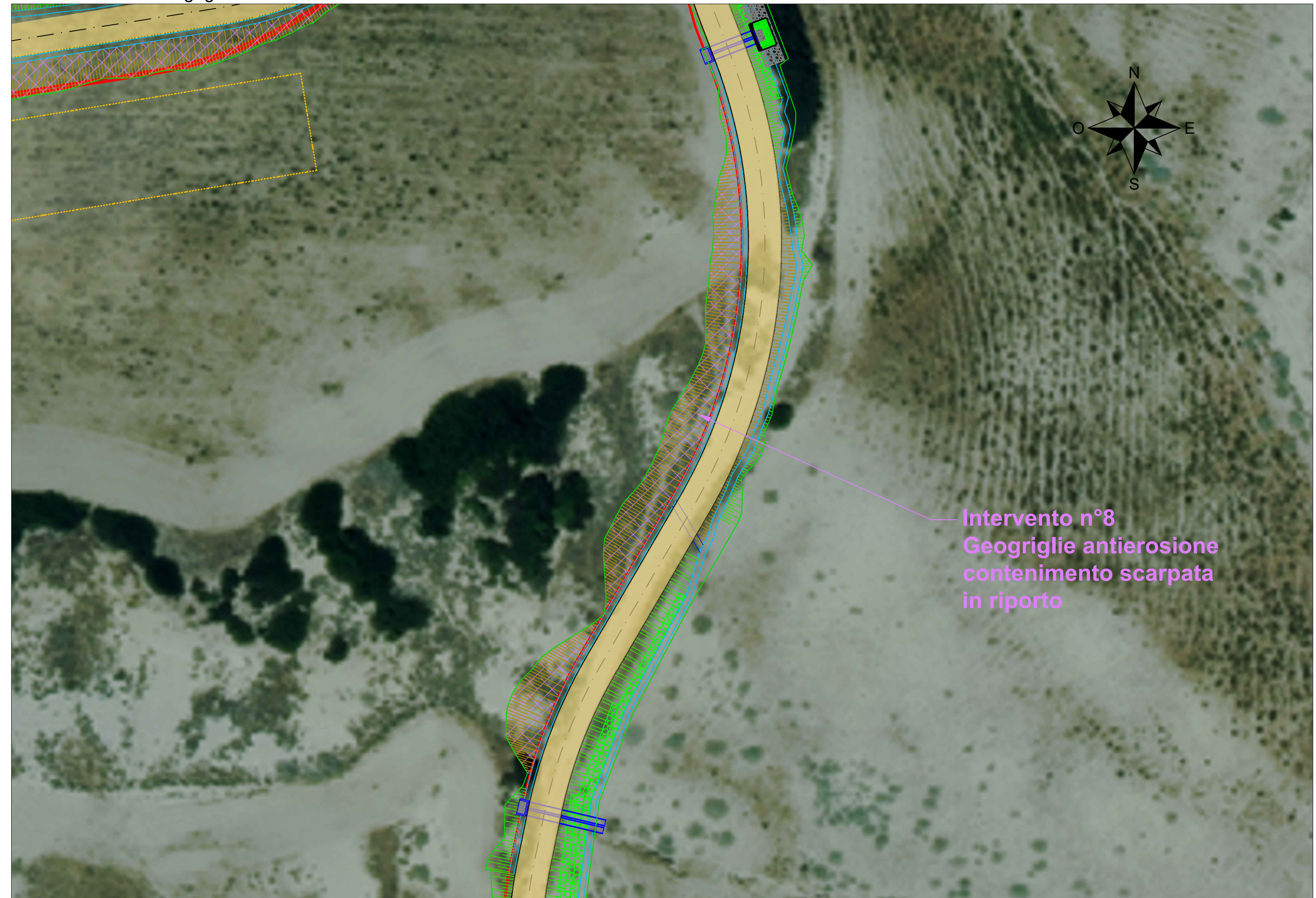
Intervento n°8 - Geogriglie antierosione - Scala 1:500

Intervento n°8 Geogriglie antierosione contenimento scarpata in riporto