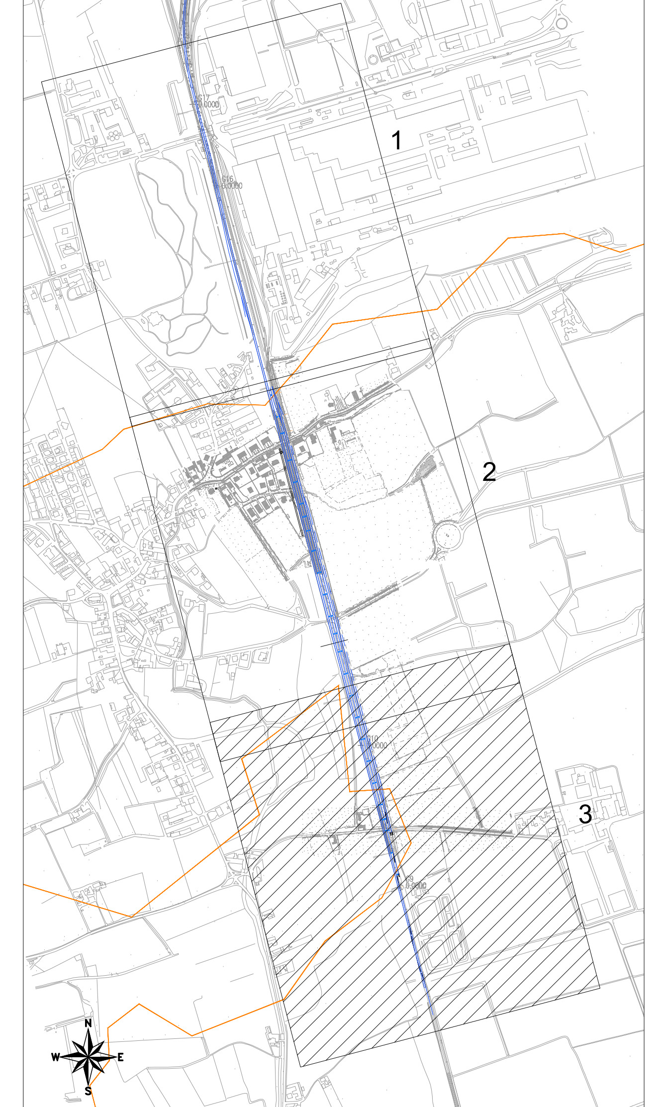
SCALA GRAFICA 1:1000 0m 10 20 30 40 50m

COMMITTENTE: RFI RETE FERROVIARIA ITALIANA GRUPPO FERROVIE DELLO STATO ITALIANE CUP: J54H17000130009